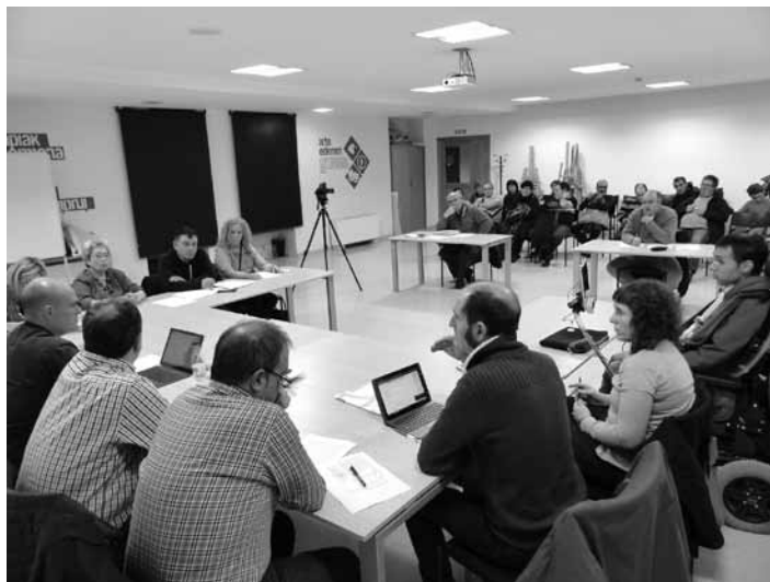
Udalbatzako kideak eta herritarrak eguaztentean osoko bilkuran. MIRARI ALTUBE

Eta bestetik, Ibarra kiroldegiko kirol zerbitzuen arduraren Athlon enpresak izango du beste bi urtez: "Granadako enpresa bat