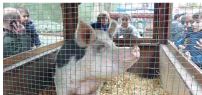
Txerrita Galartzako txerria.