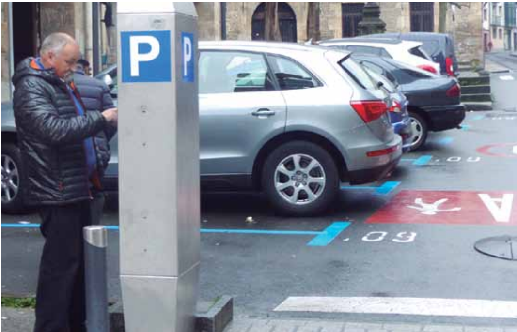
Herrigunean aparkatzerakoan, makinetan tiketa inprimatzera ohitu beharko dute orain herritarrek. ENEKO AZURMENDI