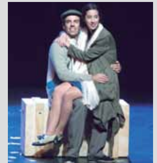
Antzezlaneko une bat. IMANOL SORIANO

Bizitzaren parte den heriotza saihestezinaren gaineko obra da, eta bakardadeari eta tristurari buruzko hausnarketari helduko dio umorearen eta musikaren laguntzarekin.