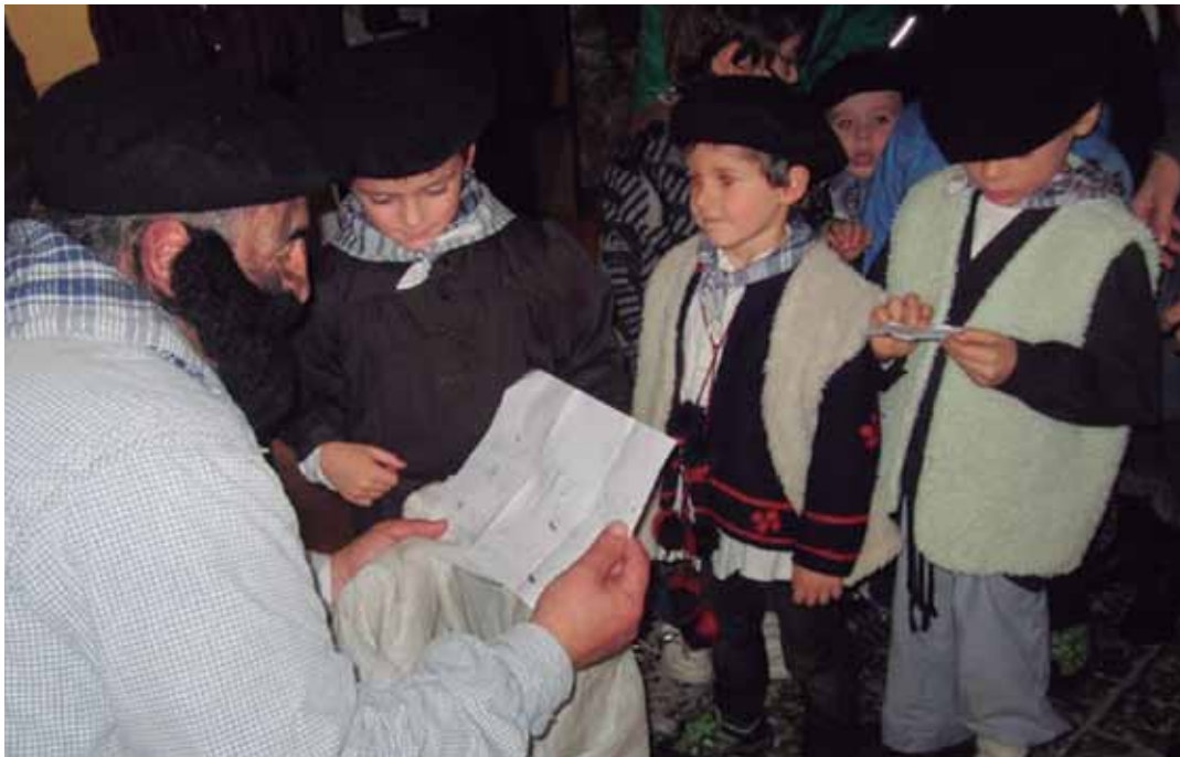
Euskal Herriko ikazkin maitatuena Aramaiora etorriko da zapatuan. GOIENA