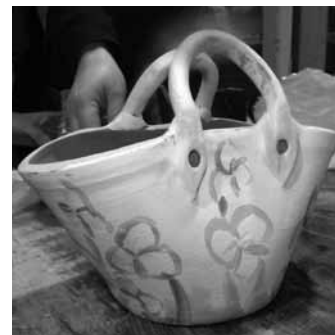
Ikastaroan egindako lan batzuk. I.B