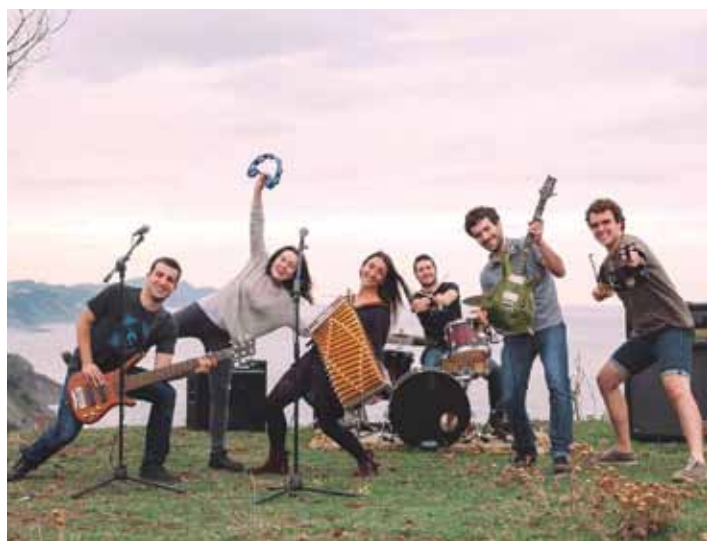
Huntza taldeko kideak. HUNTZA

Hauetan langileek dute lehentasuna, baina langabetuek ere har ditzakete. Ikastaro laburragoak dira, 40 ordukoak, eta 18:00etatik 20:30era izaten dira, lan orduetuekin uztartu ahal izateko. Hiru familian banatzen dira; Autocad eta Solidworks, Photoshop eta Illustrator, eta Kontabilitatea eta Nominak.