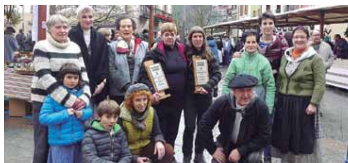
Lehiaketetako irabazleak eta Udal ordezkariak.