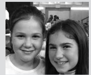
MALEN ETA IRAIA ANTZUOLA

"Bai! Aurten, gainera, lehen aldia da eta Ole Olentzero kantua abestuko dugu taldean. Letra jakin arren, erritmo bereziko kantua da. Oso polita da. Datorren urtean ea instrumenturen bat jotzeko aukera daukagun, musika asko gustatzen zaigu eta!".