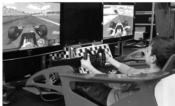
Gabonetako parkean, umea bideo jokoekin jolasten.