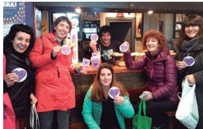
EMAKUMEON MUNDU MARTXAKO PLATAFORMA

laz izan zuen arrakasta eta harrera ona ikusita, aurten ere izotz pista jarriko dute Biterin, abenduaren 23tik urtarrilaren 9ra. Pista erabiltzeko, umeez euro bat ordaindu beharko dute eta helduek, berriz, bi euro. Aurtengoa, gainera, iazkoa baino handiagoa izango da.