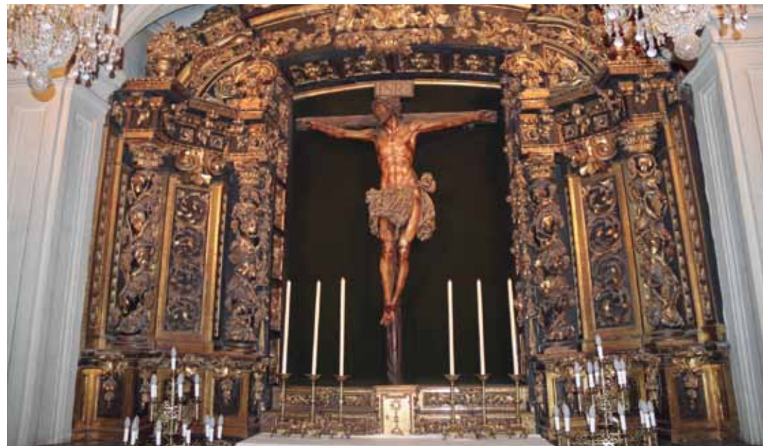
Bergarako San Pedro parrokian dagoen Santo Kristo Hilzorikoa. ENEKO AZKARATE