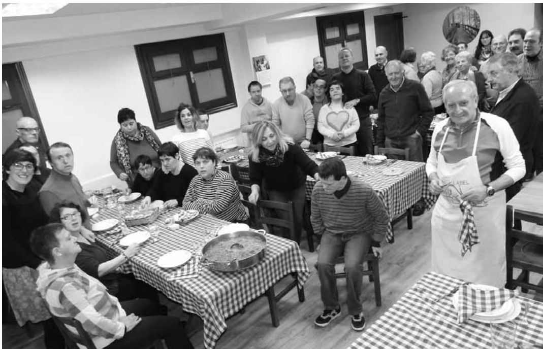
Atzegiko kideak afaltzen hasteko gertu Muru Alde elkartean. MIRARI ALTUBE