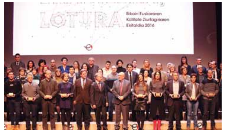
Bikain ziurtagiria jaso duten erakunde talde-argazkia. EUSKALIT

Epeleko konpost planta abiarazten dutenean, Gipuzkoak halako bi izango ditu martxan: Bergarako eta Azpeitiako Lapatx. Era berean, behin Epele zabaldua, Mankomunitatearen asmoa da Arrasateko Akei zabortegia ixtea. Gaur egun bertara eramaten da Debagoieneko errefusa, baina, Epele zabaltzeaz batera, errefus hori Elgoibarrera eramango dute eta AKEI itxi, Arrasateko Udalaren eskaera beteaz.