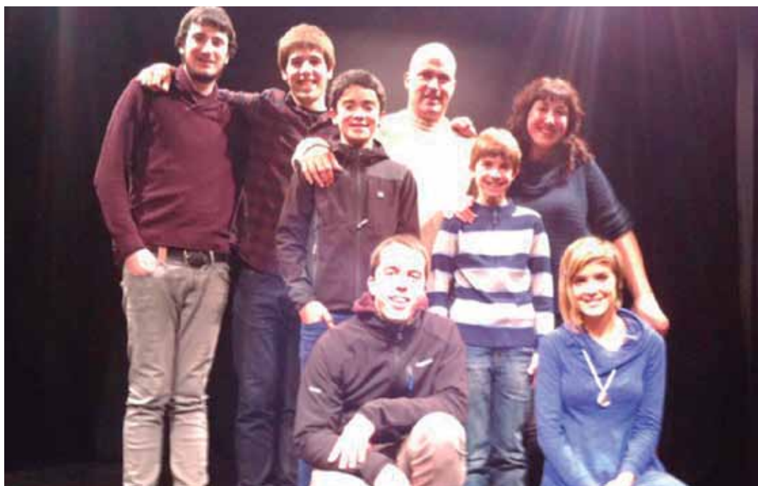
lazio saioko bertsolariak eta jai jartzaileak argazkia ateratzeko unean. ARAMAIOKO BERTSO ESKOLA