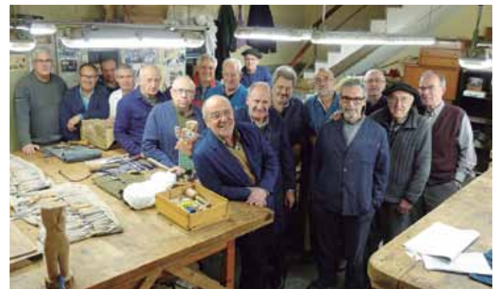
Taila eskolako ikasleak Zabalotegiko tailerrean. AMAIA TXINTXURRETA