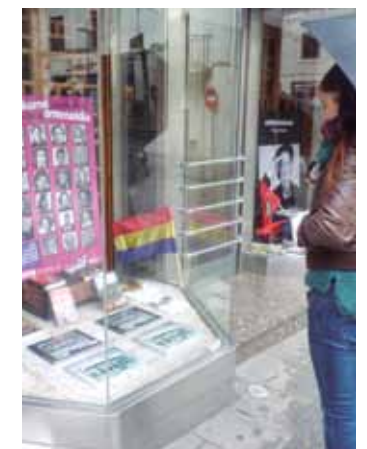
Salgai dauden liburuak. UBANE MADERA

Opari ezazu memoria leloarekin hainbat liburu jarri dituzte salgai ohi baino prezio merkeagoan Intxorta 1937 kultur elkarteak kideek. Liburu horiek, besteak beste, Gerrako garrak Oñatin , Arrasate 1936 Belaunaldi etena eta Bizitza bi aurrez aurre , Zeziaga denda zenaren erakusleihoan daude. Erosi gura dutenek Arrasate Zientzia Elkartera jo behar dute edo telefono zenbaki hauetako batera deitu: 678 24 20 31 edo 699 66 92 05. Abenduaren 31 da azken eguna.