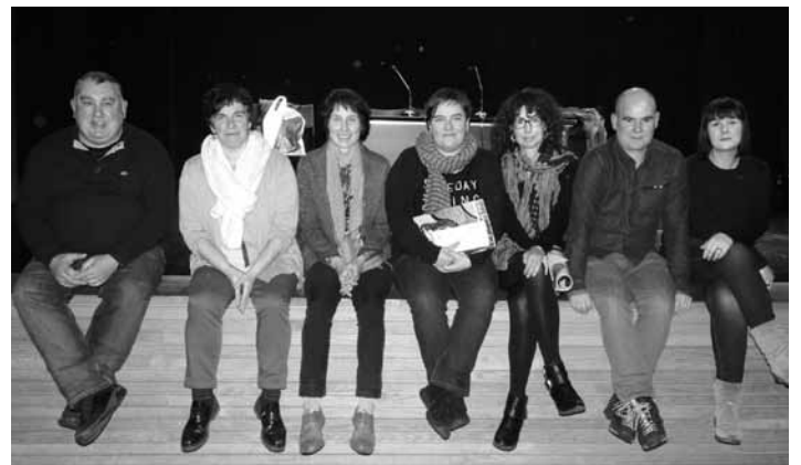
Idazle Eskolako kideak, Udal ordezkariak eta beka irabazlea (erdian). MIREN ARREGI

"Legazpiarra naiz eta urtebete daramat Aretxabalean, Atzegiko etxean. Jende asko ezagutu dut eta oso pozik nago, harrera beroa egin didate-eta herrian".