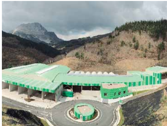
Epeleko azpiegiturak duen itxura. GHK

Lau urterako kontratua izango du lizitazioa eskuratuko duen enpresak, beste bi urtez luzatzeko aukerarekin. Prezioa: 4.908.000 euro da, 5.398.800 euro BEZA gehituta.