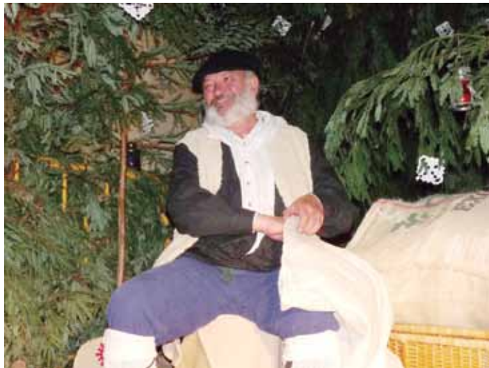
Olentzero, iaz, udaletxeko arkupean, haurren gutunak jasotzeko gertu. L.Z.

Aipatzekoa da, baita ere, gaur buztin gelan zabalduko duten erakusketa berezia. Herritarrek