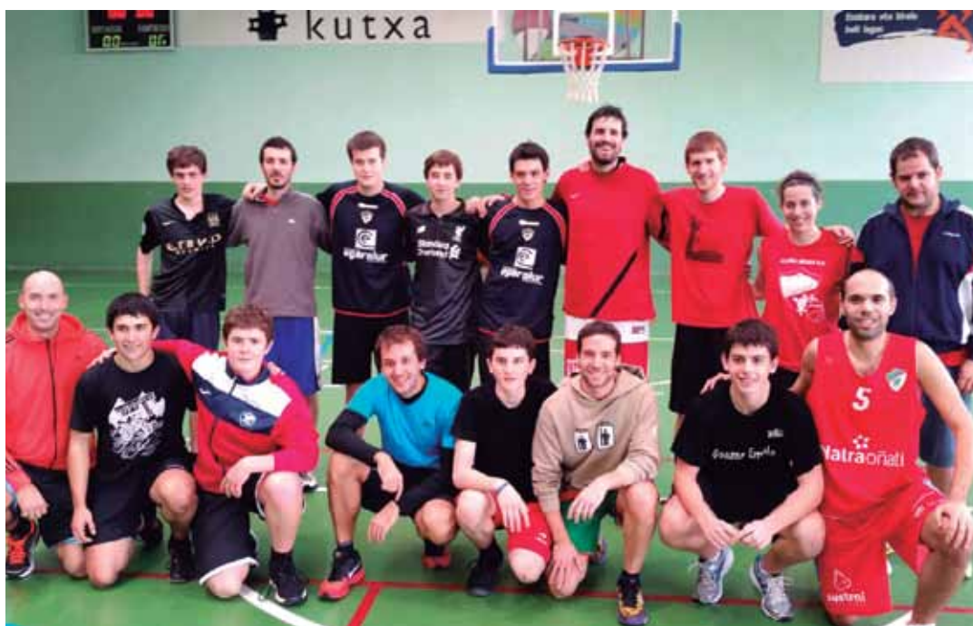
lazo saskibaloitxo txapelketako finalistak –bi taldeetako ordezkariak-. ALOÑA MENDIKO SASKIBALOI SAILA