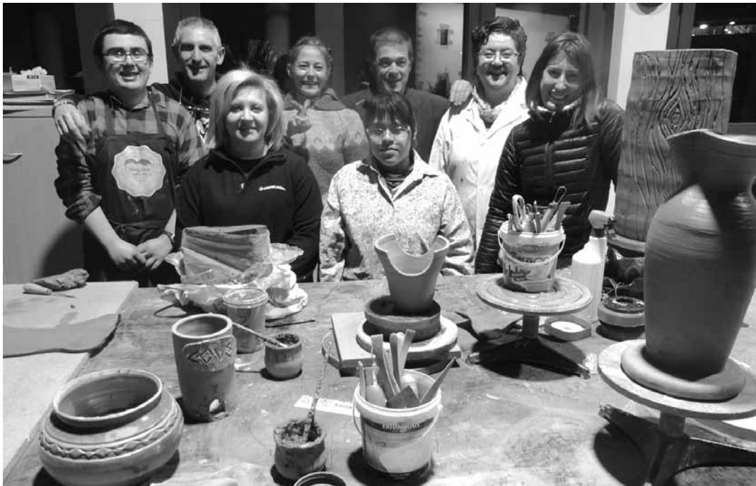
Buztingintza eta zeramika ikastaroko ikasleak eguaztenean ateratako talde argazkian. I.B