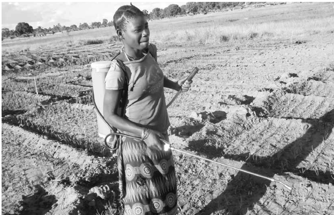
Marrupako nekazari bat, landutako lurra ureztatzen. MUNDUKIDE FUNDAZIOA