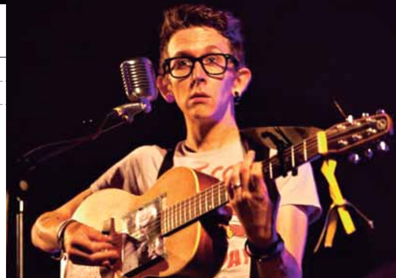
A CERTEZA DE MUSICA

ARRASATE Mirandaolara irteera Neska-mutikoendako ekintza. Ludotekan, 09:30ean.