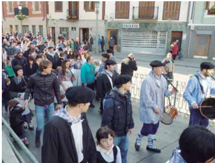
Neska-mutikoak eta gurasoak txistularien atzetik Herriko Plazara bidean.

Bizarzuri etorriko da abenduaren 31n eta Errege magoen desfilea izango da urtarrilaren 5ean; kiroldegitik irtengo dira guztiak (18:30).