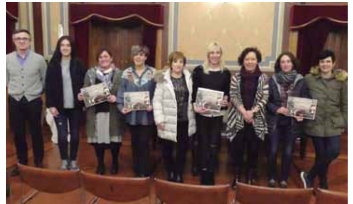
Eguaztenean, udal ordezkariak eta sarituak udalbatza aretoan. ANDER LARRAÑAGA

Lasterketa solidario honetan izen ematea librea da, baina bada baldintza bat: helmugaratzean, parte hartzaileek Gabonetako gozoren bat (turroia, mazapanak, polboroiak...) laga beharko dute Elikagai Bankuak horretarako