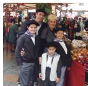
Familia bat baserritarrez jantzita.