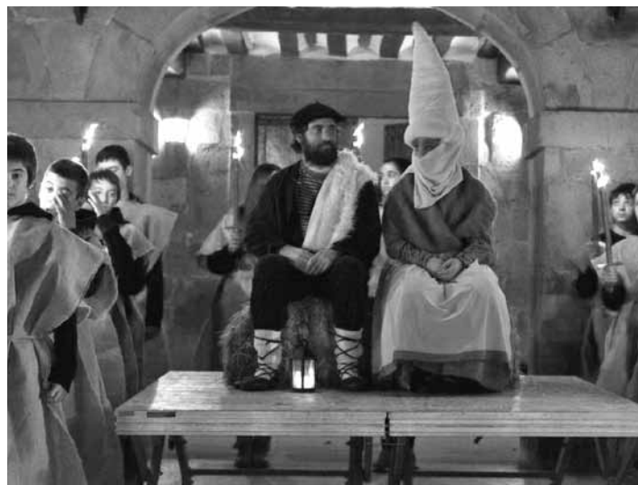
Olentzero eta Mari Domingi Herriko Plazan. IKER AIZKORBE

Mozorroztuta, kuadrillan, bikoteka, familian, bakarka... abenduaren 26an, San Esteban krosa egingo da. 17:30ean 5 eta 8 urte artekoak irtengo dira; 17:45ean, benjamin, alebin, infantilak. 18:00etan, kadeteak eta hortik gorakoak. Eta kirolarekin ja-