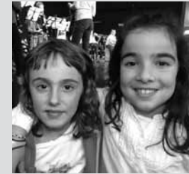
LORE ETA UDANE ANTZUOLA

"Bai! Aurten, gainera, lehen aldia da eta Ole Olentzero kantua abestuko dugu taldean. Letra jakin arren, erritmo bereziko kantua da. Oso polita da. Datorren urtean ea instrumenturen bat jotzeko aukera daukagun, musika asko gustatzen zaigu eta!".