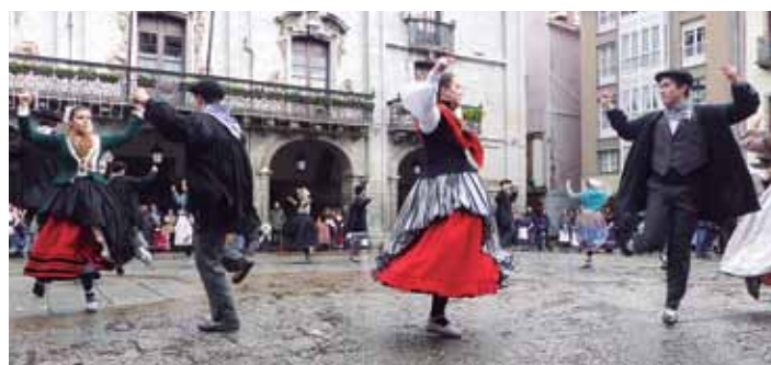
Dantzariak atzo goizeko emanaldian.