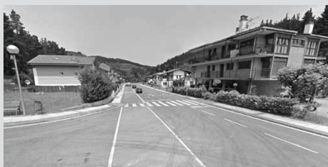
Kuartuena urbanizazioan jolas-parkea egingo da.

Hurrenez hurren, Kuartuena urbanizazioan jolas-parkea egingo da eta Apotzaga auzoko jolas-parkea konponduko da, besteak beste.