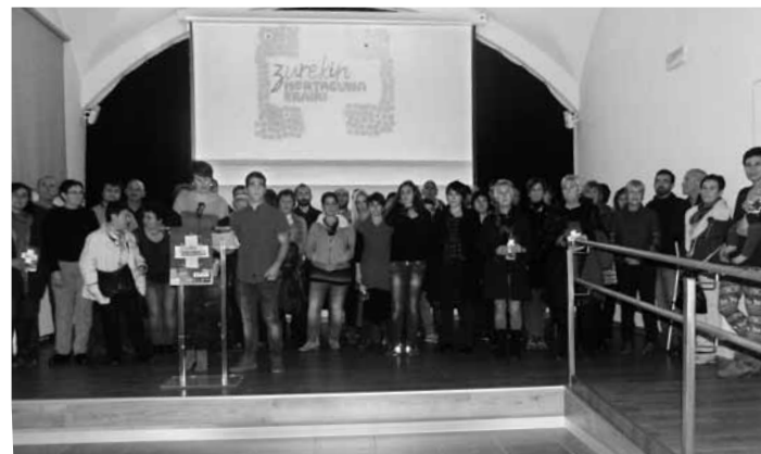
Ekimenaren bultzatzaile diren elkarteetako kideak Kulturateko aurkezpenean . M.A.

Astelehenean Zurekin Arrasate euskaldunago kanpaina jarri zen martxan. Kulturateko aretoan egindako aurkezpenean, eta indarrak batzeko asmoz, herritarrak elkarte horietara batzera animatu zituzten Txatxilipurdik, Ekin Emakumeek eta AEDk