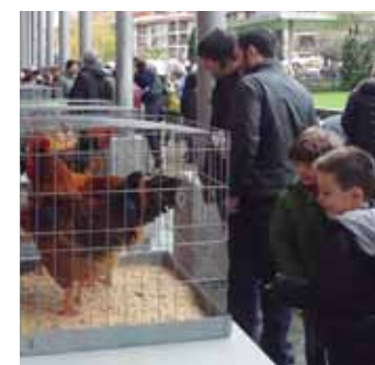
Herritarrak oilarrei begira.