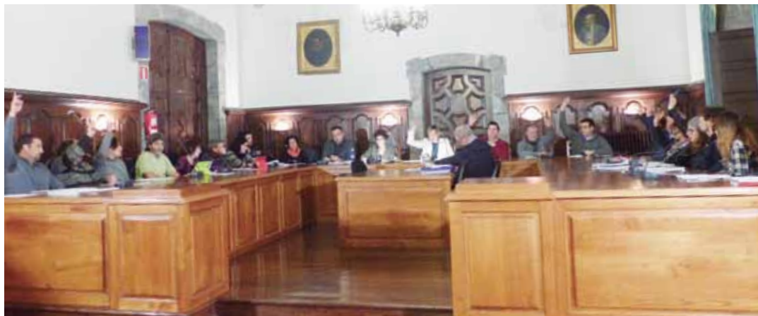
Aurrekontuaren bozketa: EAJ eta PSE-EE alde (11), Baleike eta Irabazi kontra (3) eta EH Bilduren abstentzioa (7). JOKIN BEREZIARTUA