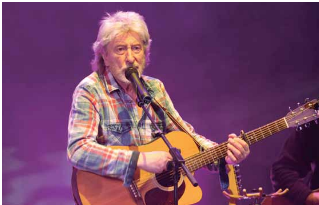
Benito Lertxundi emanaldi batean.