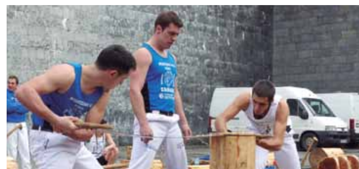
Trontza ikuskizuna.