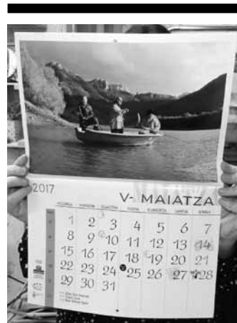
Bezero bat egutegiarekin. M.A.

Hainbat herritar izan ziren eztabaida jarraitzen bilkuren aretoan, eta horietako batzuek ezin ulertua agertu zuten beste elkarretaratzeko batzuk deitu izan dituelako Udalak. Azkenean puntuz puntu bozkatu zuten mozioa eta aho batez onartu, besteak beste, preso gaixoak eta adin batetik aurrerakoak libre gertatzeko legezko mekanismoak martxan jartzea eskatzea eta Espainiako Gobernuari legea betearaztea exijitzea. Eztabaida sortu zuen puntuan abstenitu egin ziren jeltzaleak eta sozialista, hortaz, aurrera egin zuen mozioak: "Oso pauso garrantzitsua da, denok egin dugulako esfortzu bat akordiorako. Hala, aurrera atera da eta Udalak deituko du elkarretaratzeko hori", zioen Albizuk.