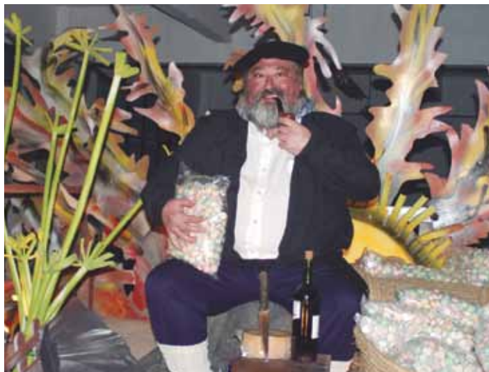
Olentzerori 19:00etan egingo diote agurra, Herriko Plazan. GOIENA

Arratsaldean, berriz (17:00-20:00), Uarkapeko ateak irekiko dituzte, eta bertan izango da Txikilandia hiru egunez, urtarrilaren 4ra arte. Sarrerei dagokienez, 1-3 urte bitarteko haurrek 3 euro ordaindu beharko