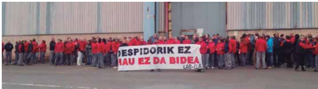
Eguaztunen goizean Garagartzan egindako elkarretaratzea. XABIER GOROSTIDI