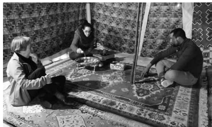
Gazte txokoko gaztetxoak ibili ziren pintxoak prestatzen. MAITE TXINTXURRETA