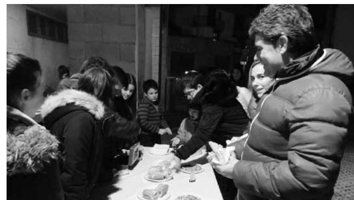
Zurrategin haima bat muntatu zuten. MAITE TXINTXURRETA

Urtarrilaren 2an, umeendako ikuskizuna: Patata Tropikala taldearen Ezer ez da dirudiena . Torresoroan, 18:00etan.