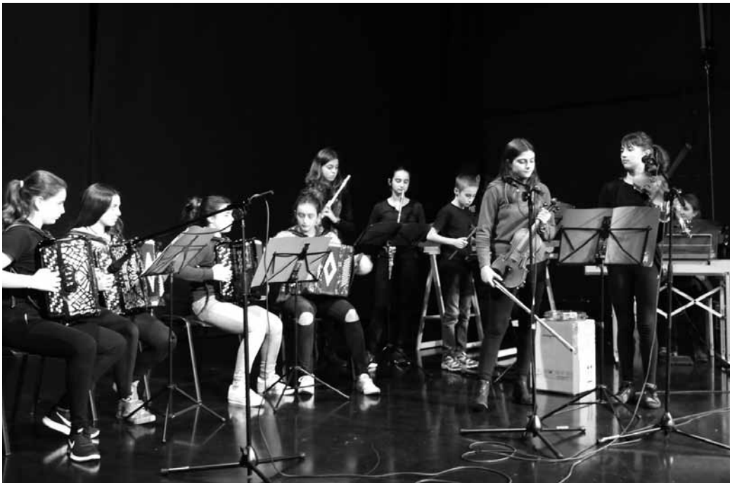
Akordeoekin, biolinekin, flautekin, pianoekin eta xilofonoekin, doinu ezagunak izan ziren entzungai. MAIDER ARREGI