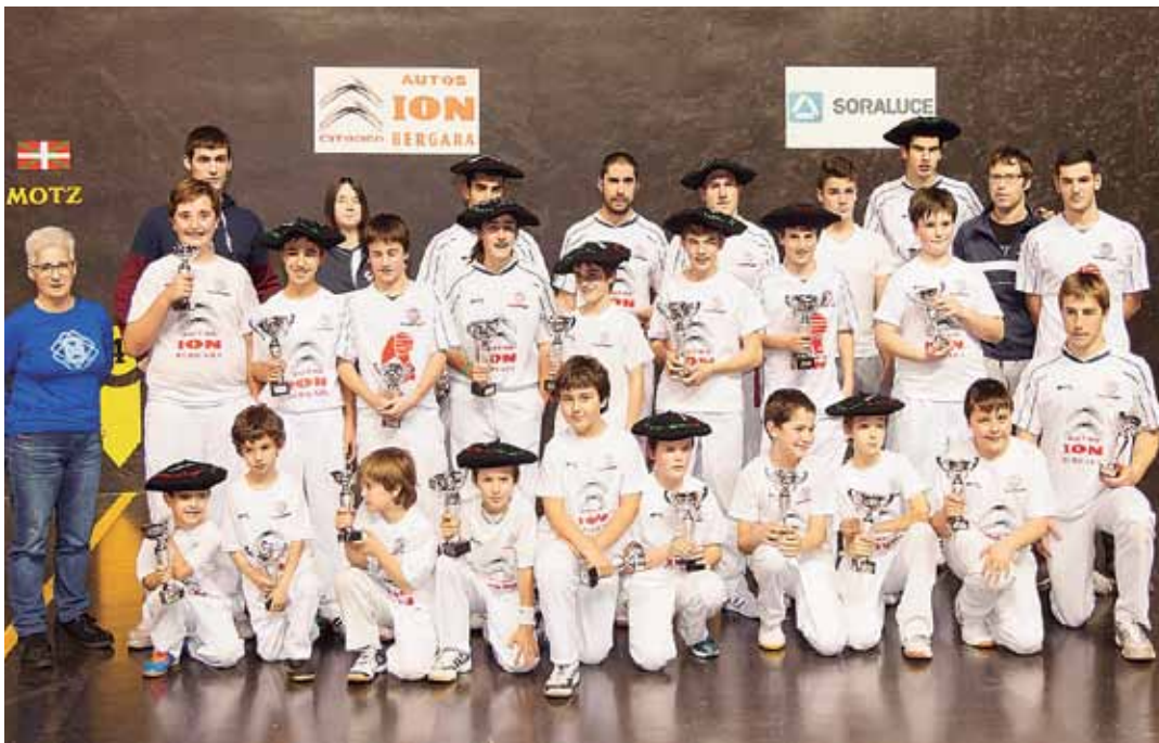
Iazko Gabonetako pilota txapelketako sari banaketa. GOIENA