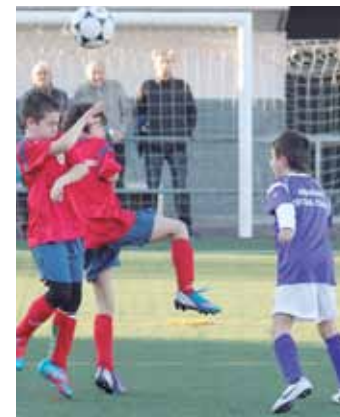
Gaztetxoak Ibarren, iaz.