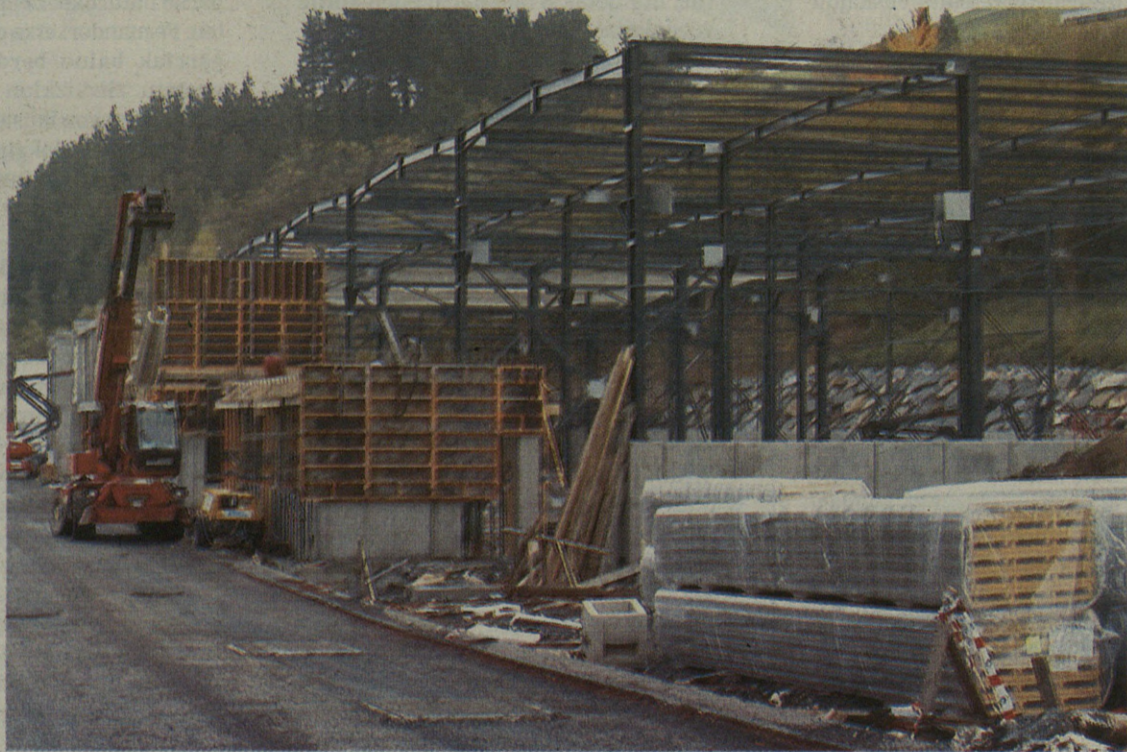
2004. urterako bukatuko dituzte industrialdeko lanak

Lanpostu berriak sortu eta Eskoriatzatik kanpoko enpresak industrialdean kokatzea dute helburu, besteak beste, arduradunek. Guztira 2.400 lanpostu berri sor-