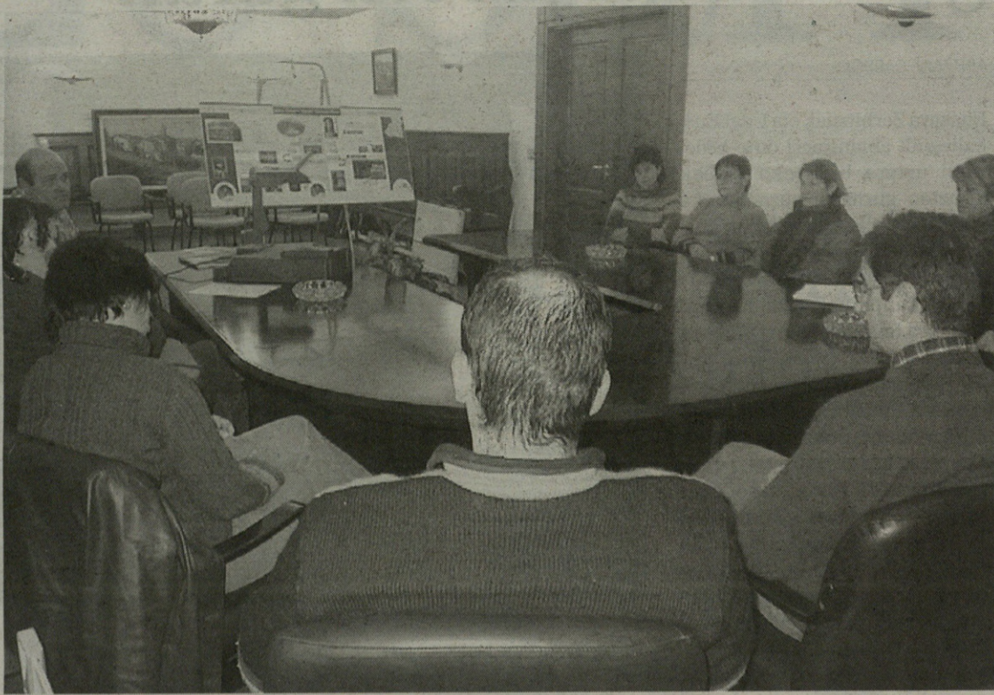
Elkarren proiektuen berri eman zuten bileran

Gatzagako Udalak denda jarri gura du herritarrendako, eta alkatearen arabera, "kudeaketari dagokionez, denda museoarekin bat egitea nahiko genuke, hau da, pertsona berberak arlo bi horiek proiektu bakarrean uztartzea; horregatik jakin gura izan dituzte