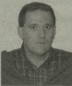
"Jarraitu beharreko ildoak, pertsonetan inbertitzea"

Duela 10 urte bultzatutako 1go Herri Garapen Planaren ondorioz hainbat arlotan herriaren berreraikitze prozesuan pauso garrantzitsuak eman ziren: azpiegiturak