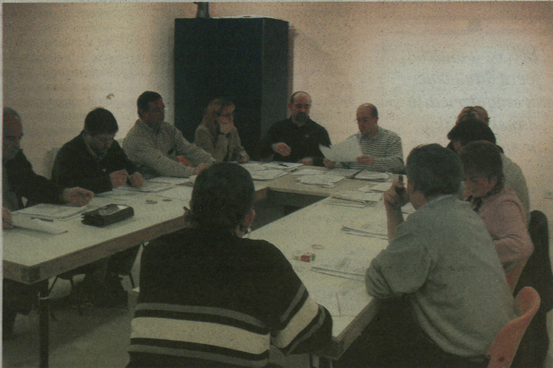
Martitzenean onartu ziren 2002. urteko ekitaldirako aurrekontuak.

Guztira sei miloi eta bostehun mila eurotik gorako aurrekontua onartu da. Ezker Batuko zinegotziek izan ezik, Udala osatzen duten gainerako ordezkariak eman zieten baietza proposatutako aurrekontuei.