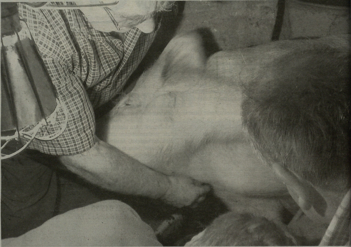
Kuadrilatxoak behar da txerriari eusteko.