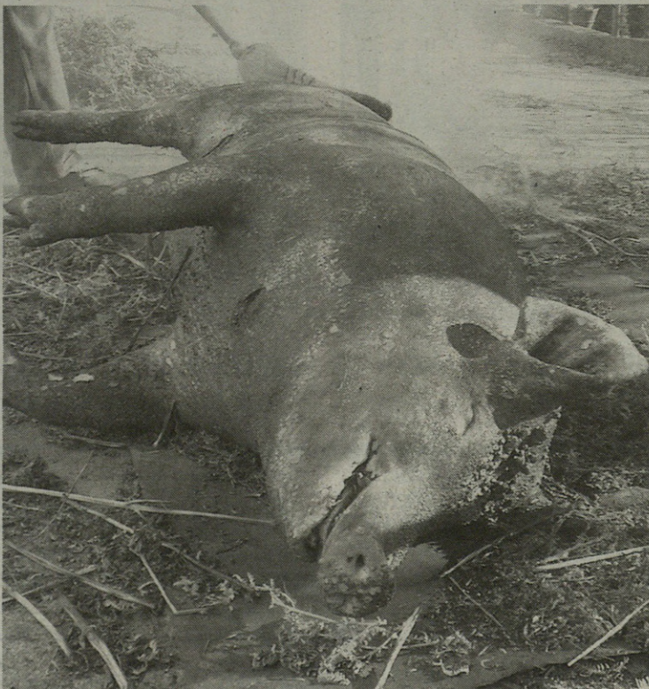
Hil ondoren iratzeaz erretzen da txerria leku askotan.