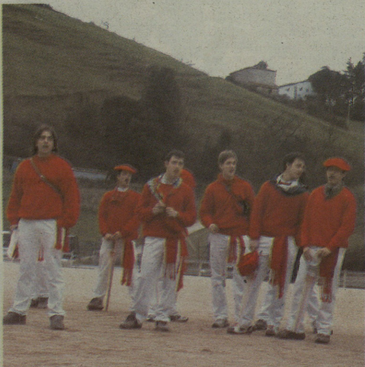
Hemeretzi Santa Ageda mutil dira aurten, inoiz baino gutxiago.

Eskoriatzako Santa Ageda mutilak beste herrietakoak baino urtebete gazteagoak dira; izan ere, oraindik betetzeko dituzte 18 urte. Azkeneko urteetan, ohiturak agintzen duen moduan, bez-