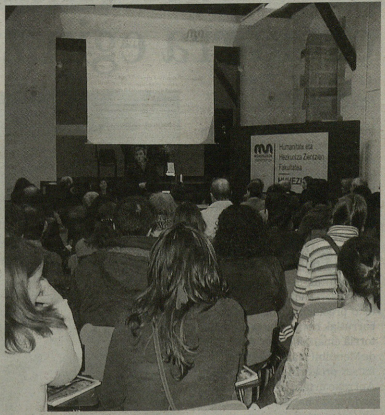
Gazte eta guraso asko izan ziren HUHEZIn.

mititzeko garrantziaz mintzatu zen. Guraso gutxi izan ziren. “Eskolari delegatu diogu, gauza askotan, gure seme-alaben ardura”, gaineratu zuen hitzaldia amaituta Alberdik. Haren ustez, euskarari gurasoek ematen dioten garrantziaz jabetu behar da umea, gero, hizkuntzaz disfrutatzen.