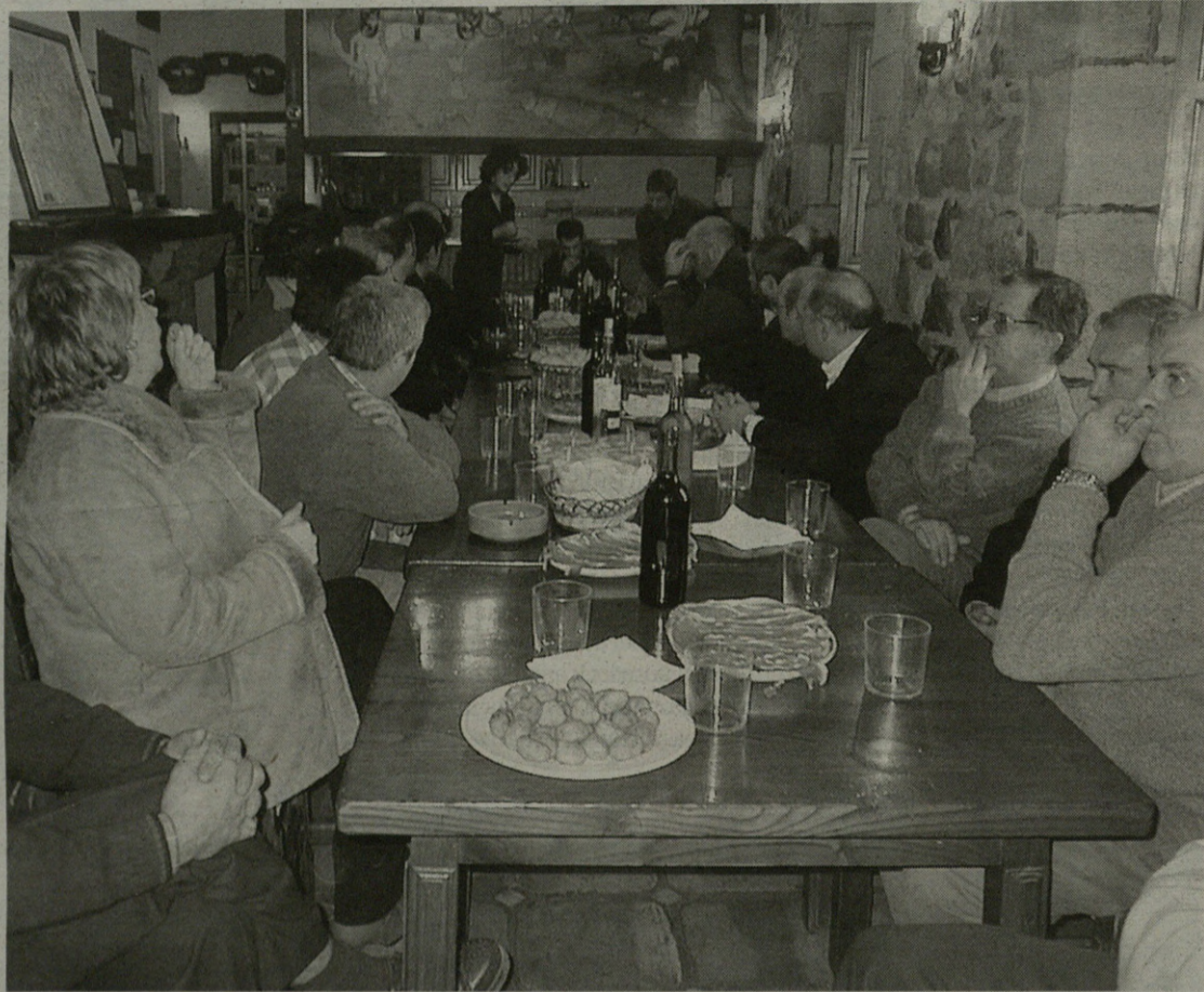
Toki Eder elkarteko bazkideek urteko batzarra egin zuten martitzenean.

Eskarien eta galderen tartean, hainbat proposamen egin