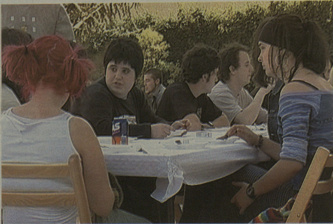
Gazte ugari egin zioten ongietorria urtaro berriari.

Eguerdiko ordu batean, triki-poteoan elkartu ziren gazteak. Gero, 60 lagunek bazkaria egin zuten elkarrekin, eta arratsaldean, hiru kontzertuekin gozatze-ko aukera izan zuten. "Egun poli-