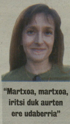
"Martxoa, martxoa, iritsi duk aurten ere udaberria"

"Martxoa, Martxoa, iritsi duk aurten ere udaberria, eta hi dagoeneko azkenetan hago! Baina aurtengoan ere ez duk lortu nire ardi bakar bat ere akabatzerik heure hotz eta euriekin! Izorra hadi! Ja, ja, ja!"