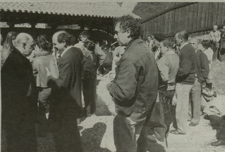
Herritar asko batu zen ekitaldian, eta gero, Sorgina taldeko kideek taloan banatu zizkieten gonbidatuei eta herritarrei.

Luncha egon zen guztiendako, baina Sorginak emakume taldeko kideek egindako talo gozoekin, gonbidatuek gehiago disfrutatu zuten dudarik ez zen izan. Ekitaldiaren ondoren, Gatz Museoaren ikusteko aukera ere izan zen.