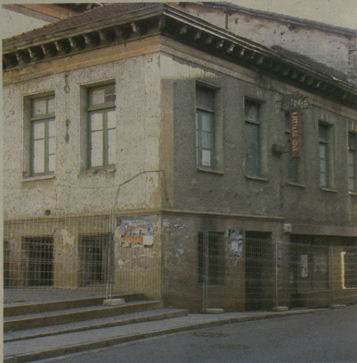
Itxuraldaketa handia izan du Arana kaleak.

Apirileko lehenengo astean, Arana kaleari tokatu zitzaion txanda; izan ere, kalea autoendako itxi eta Jose Arana eskola zaharretarainoko etxe-ilara guztia bota dute. Hantxe, 43 etxebizitza egingo dituzte: 11, ekimen pribatukoak, eta beste 32ak kooperatibak