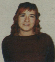
"Frente Polisarioaren babes osoa dute"

Emakume saharaiarrek dira bien bitartean benetako iraultza egiten ari direnak. Beraien aita, seme eta senarrek bederatziz hilabete egiten dituzte frontean, eta bitartean herriaz arduratzen direnak bertako emakumeak dira. Beren herriaren askapenaren alde ari dira lanean,