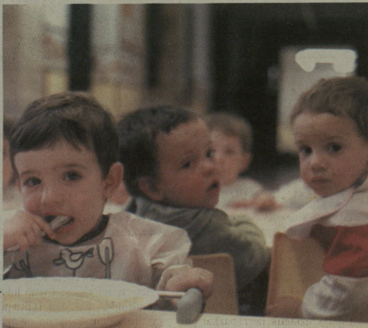
Herriko txikienak izango dira ikasturtea amaitzen azkenak.

teak teknologi berriei bultzada handiena eman dion ikasturtean, 887 ikasle izan dira.