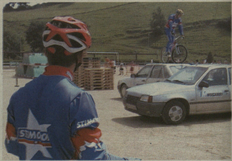
Trialsin erakustaldiak jendearen interesa piztu zuen.

Saskibaloian, eskubaloian eta futboleko ari diren hamaika taldeek trofeo bana jaso zuten ondoren, eta talde bakoitzeko jokalaririk onenak ere garaikurra jaso zuten. Jokalariek eurek aukeratu zuten taldekide onena. Horren ondoren, 130 lagun batu ziren herri bazkarian. Jai horrekin, 25. urteurrenaren ekintzak amaitu ditu KEK.