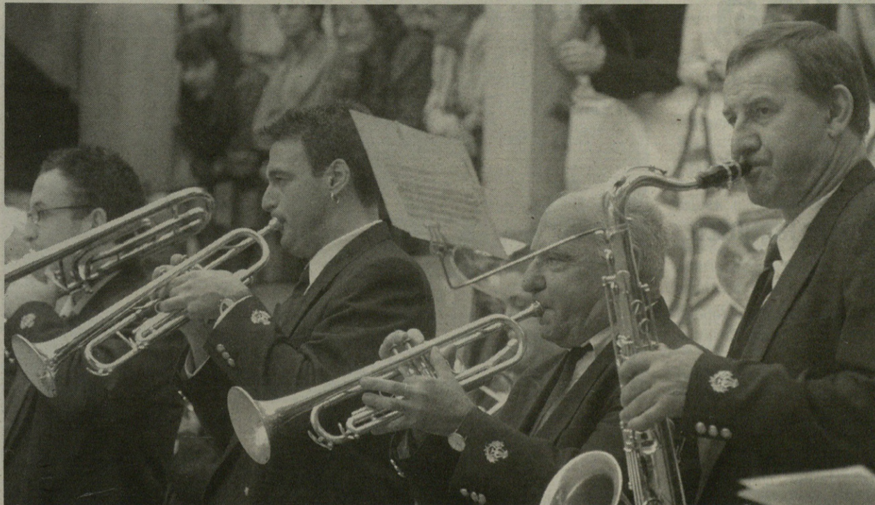
San Pedro egunean, meza osteko kontzertua emango du Musika Eskolako Bandak Gorosarri plazan.

Hainbat ekitalditan hartuko du parte Musika