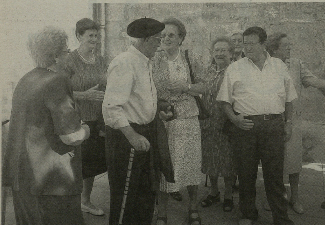
Aurrerantzean, bi hilean behingo batzarrak herriz herri egingo dituzte erretiratuek.