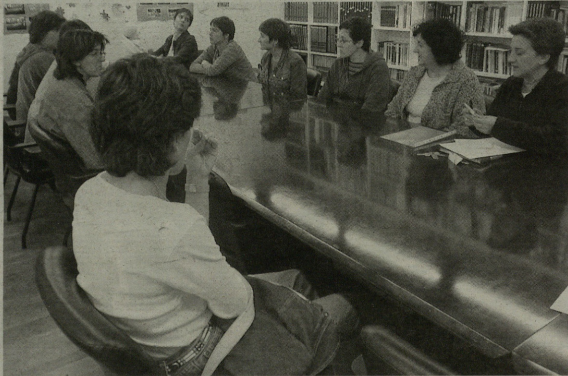
Lehenengo batzarrean argitu gabeko puntuak aste bi barru lotzekotan gelditu ziren batzordekideak.

Urrian irekiko ditu ateak ludotekak. Begiralearen kontratazioaz,