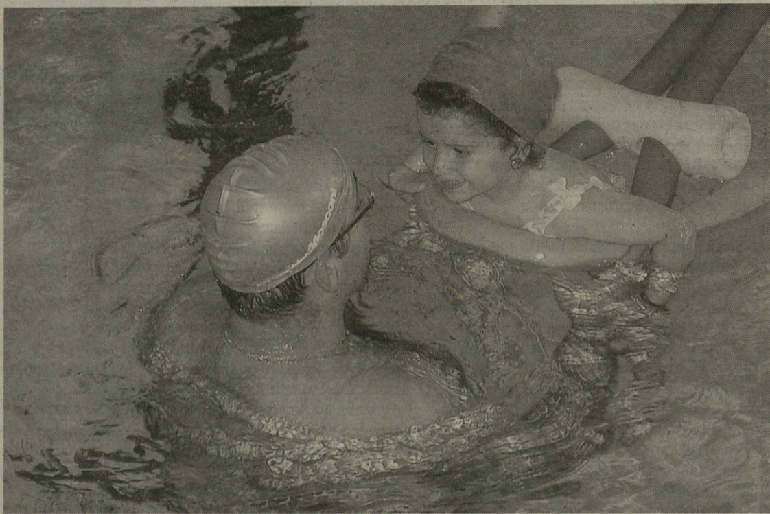
Igeriketak izan du eskaintako kirol ekintzen artean arrakastarik handiena.