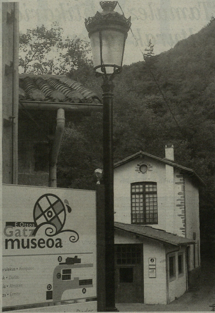
Bi mila lagunek bisitatu dute Gatz Museoa aurten.