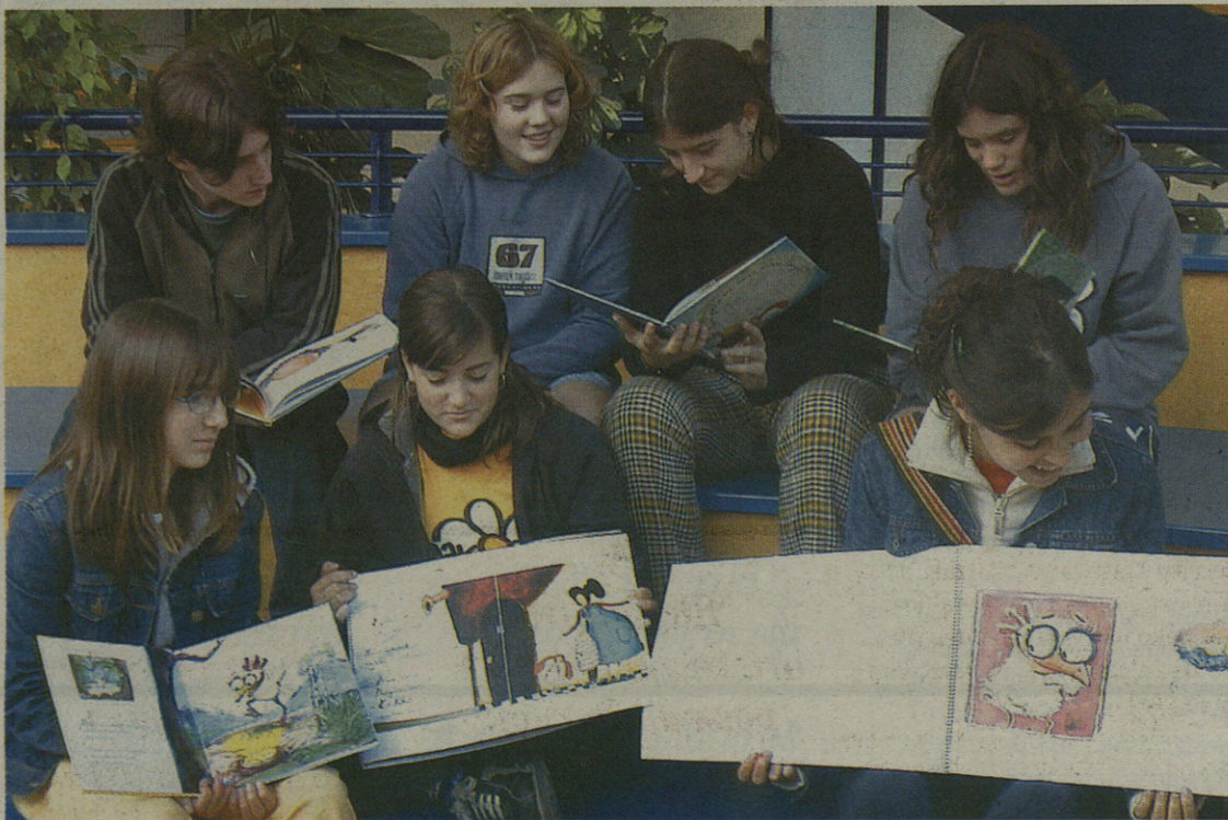
Ipuin kontalari gazteak, txikienei kontatuko dizkietenak prestatzen.

Duela zazpi urte herriko bertako auzoak ezagutu eta gero, Bolibar, Marin, Apetzaga, Mendiola eta Zarimutz ere bisitatu dituzte Ezkurtxoren eskutik herriko umeak: "Ideia horrekin jaio zen Ezkurtxo. Umeek, eta askotan gurasoek ere, ez dituzte ezagutzen herriko elizateak. Urte hauetan Eskoriatzako auzuneetan ezusteko atseginak jaso dituzte askok", esan digute ikastolako antolatzaileek. Euskal mitologiarekin eta auzoekin lotutako gai konkretu bat landu izan dute beti. Aurten, mitologia eta historia kontuak alde batera utzita, natura hartu dute gai nagusi. Bihar, zapatua, 16:00etan, hainbat zuhaitzen hostoak identifikatu beharko dituzte umeek egingo duten ibilalditxoan. Horren ondoren, Arizmendi-Almen guneko ikasle nagusiek