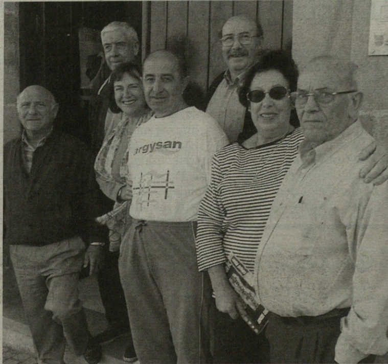
Olazarreko batzordekideek bidaiaren balorazio oso ona egin dute