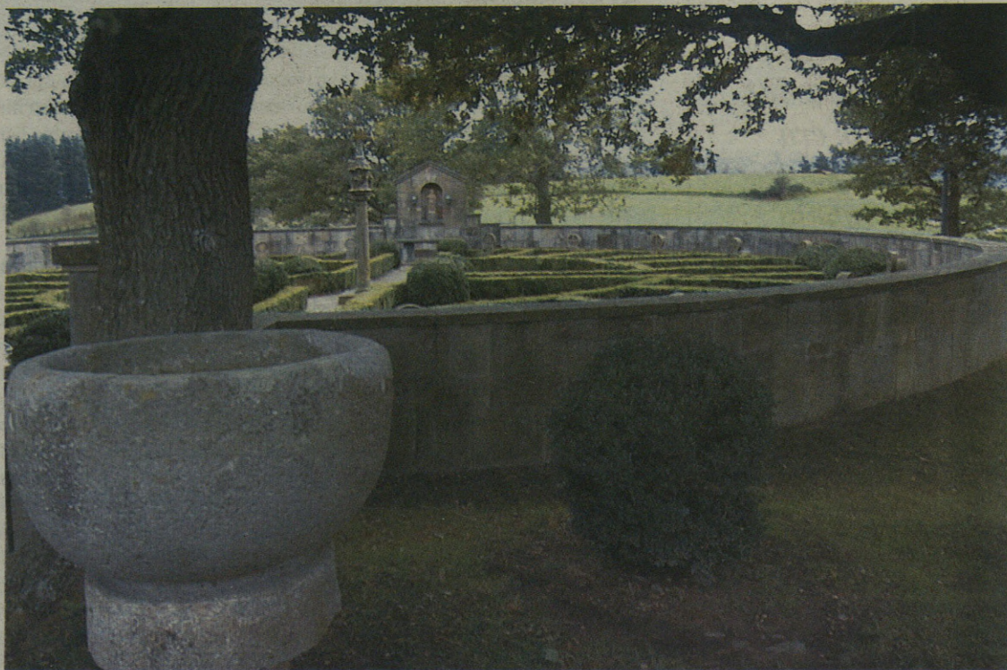
Apotzagako kanposantua da inguruko artean bisitatuena.