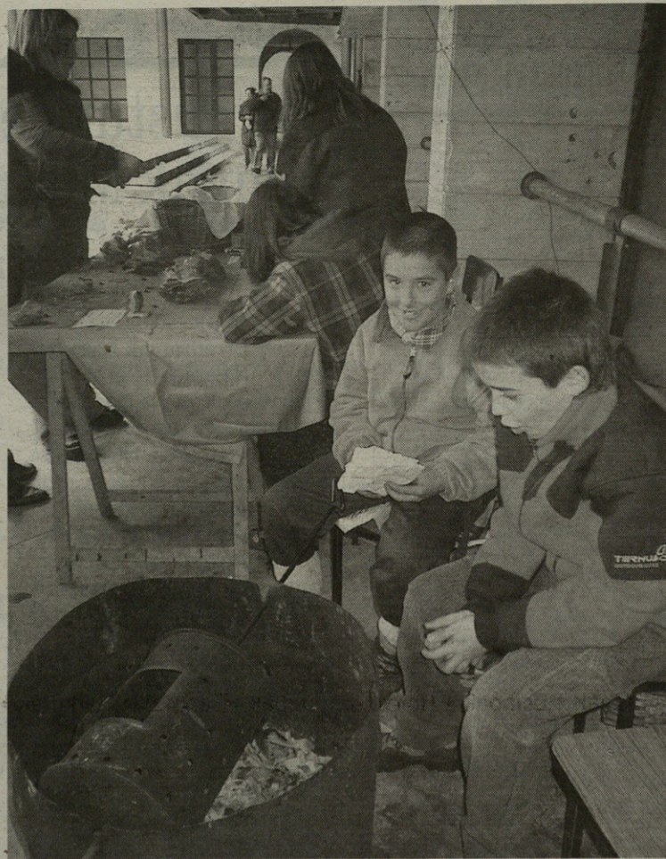
Iaz, gazteek, danbolinari eragin eta eragin, gatzainak erre zituzten.

"Lixiba egiteko prozesua ez da erraza, baina ahaleginduko gara"