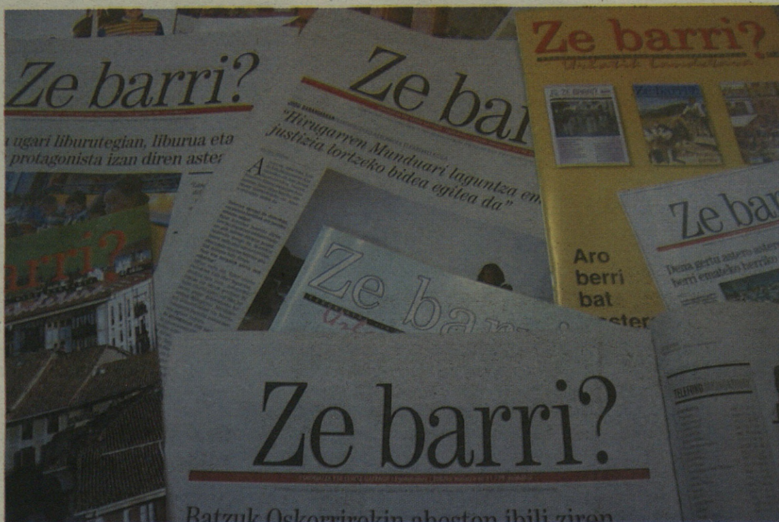
Datorren otsailetik aurrera orri gehiago izango ditu ZE BARRI? URLATIK LANDETARA astekariak.

Joan den urtean, urriaren 19an, guztiz itxura aldatuta etorri zen Eskoriatzako eta Gatzagako aldizkaria, bai maiztasunari, bai formatuari, bai eta lantaldeari dagokionez ere. Astekaria da ordutik hona ZE BARRI?, eta aldizkari formatua atzean utzita, egunkari