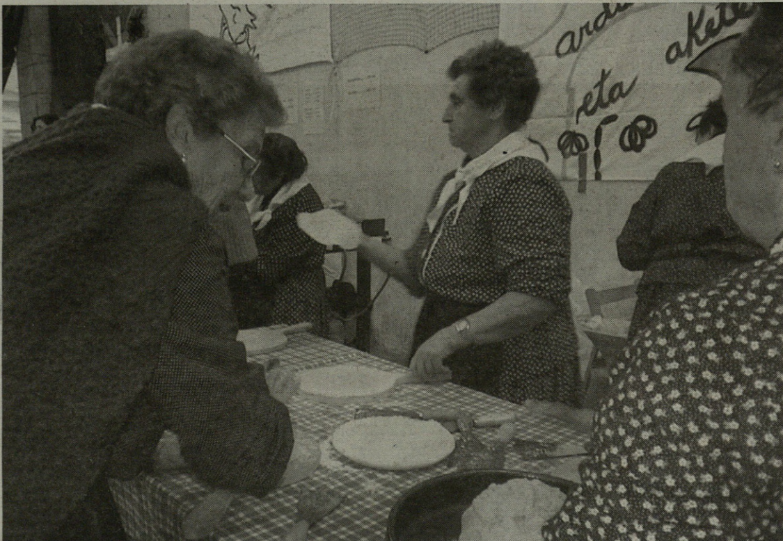
Aurten, X. Langintzen Ferixako egunean, emakumeek hartu dute ohitura zaharrak suspertzeko ardura handien.

Gatz Museoa, bestalde, 11:00etatik 14:00etara eta 16:00etatik 18:00etara egongo da zabalik. Eta domekan bertan -egun osoan-