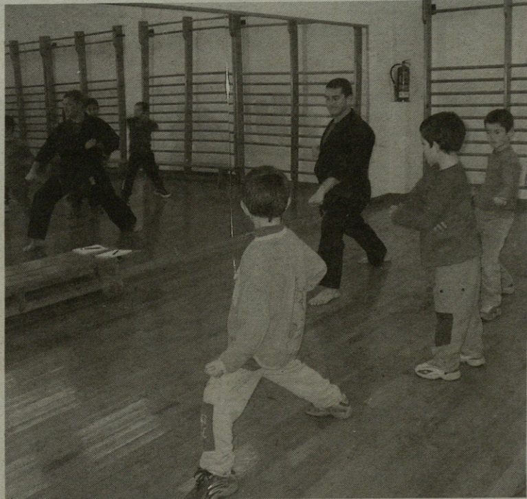
Koordinazio eta psikomotritate jokoak egiten dituzte umeek saioetan.

Joan den urtean, zortzi eskoriatzar hasi ziren Rafarekin batera kenpoa egiten. Eta aurten, sei eta zortzi urte bitarteko 15 ume hasi dira kirol hori praktikatzen: "Oso ondo pasatzen dute. Koordinazio eta psikomotritate jokoak eta beharrezko orekarekin mugitzen jakiteko teknikak lan-tzen ditugu. Oraindik ez dute borrokarik egiten".