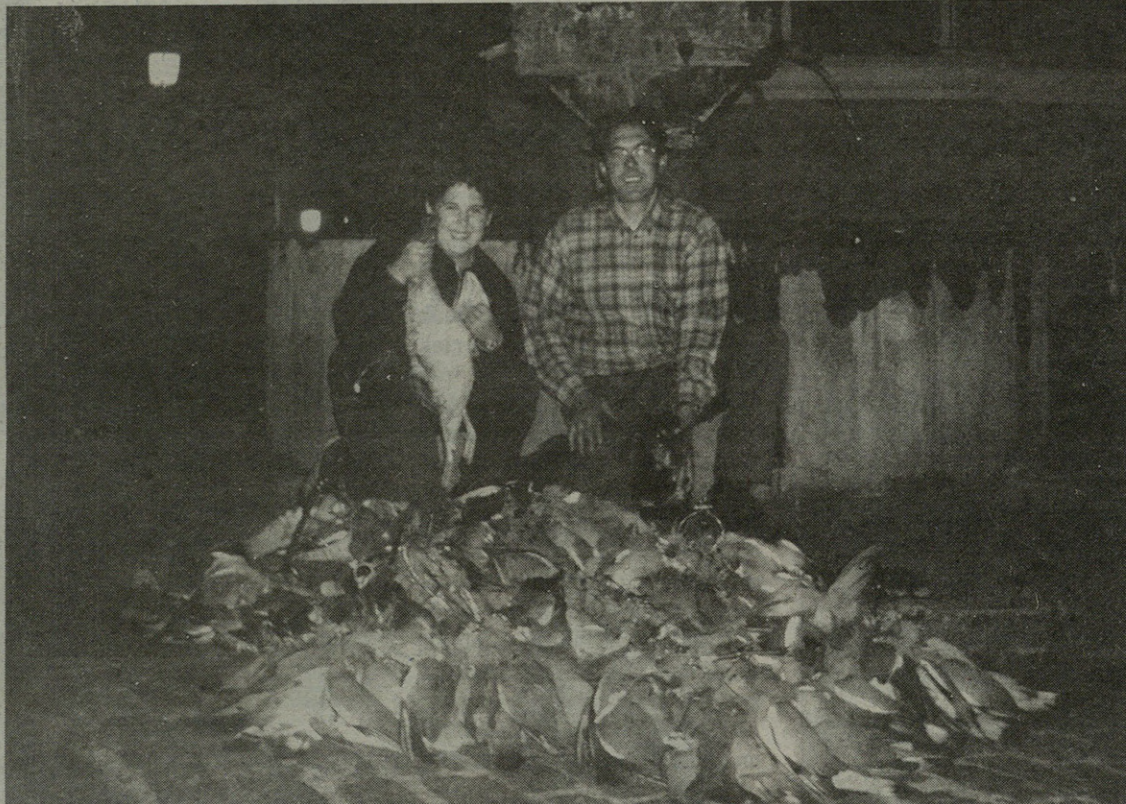
Azaroaren 29an, Inaren eta anaiaren artean 230 uso bota zituzten. Argazkia -kalitatezkoa ez bada ere-, horren lekuko.

"Etxerako ere utzi ditut ehizaki batzuk, uso-salda baino estimatuagorik ez dut-eta"