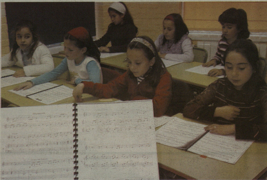
Musika Eskolan irakasleek garrantzi handia ematen diote hizkuntza musikalari.

Urte batetik bestera gero eta ikasle gehiagok ematen dute izena Musika Eskolan aritzeko. Bost urtetik gorako 140 ikasle dituzte oraingo ikasturtean; umeak bakarrik ez, helduak ere joaten dira musika edo kantu ikasketak egi-