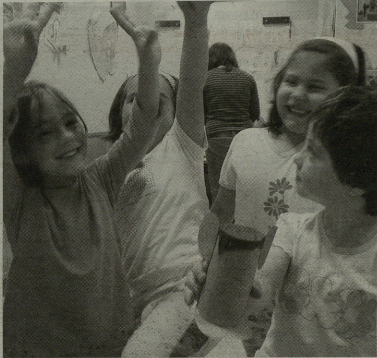
Gurasoek eta umeek ia ehun jostailu izango dituzte ikusgai oraingo asteburuan.