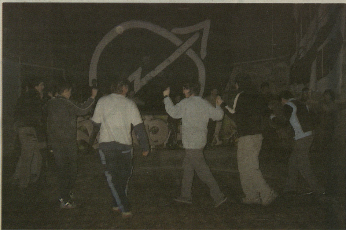
Gazteak herriko gaztetxean elkartu dira dantzak ikasteko, astean hirutan.

Zapatila zuriak kordel gorriekin eta sorbaldan loredun zapi