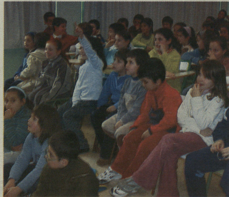
Luis Ezeizako umek adi jarraitu dituzte Kultura Asteko ekitaldi guztiak.

Astean egin dituzte ekitaldien artean, Luis Ezeizako arduradunek Panta Rhei taldeak egindako Beltzitina antzezlan nabarmendu dute. Beltzitina -k atzerapen psikikoa duen neskatxo baten istorioa kontatzen du, eta irakasleei gai horrek asko lagundu die hainbat giza balio lantzeko.