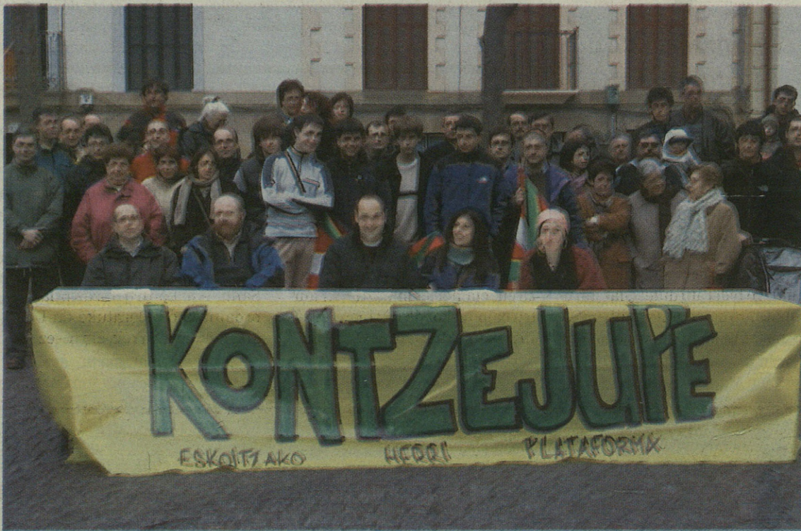
Hiru zutabe nagusiren ildotik lan egin gura du Kontzejupe herri plataformak.

Kontzejupe herri plataforma sortzeko asmoz, orain dela hilabete inguru hasi zen herriko lagun koadrila bat lanean: “Herriko asko-