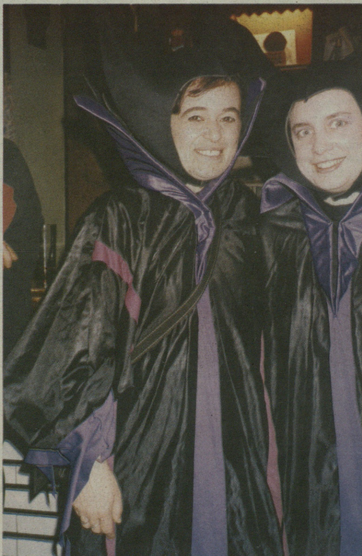
Umeek etxera erretiratu ondoren, banpiroek hartu zituzten kaleak.

Martitzenean, tamaina txikiko txinatarrak, indiarrak, suziriak... eta beste izan ziren