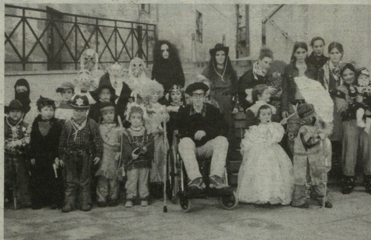
Txikienek, gura beste jolas egin eta gero, desfilea egin eta argazkia atera zuten.