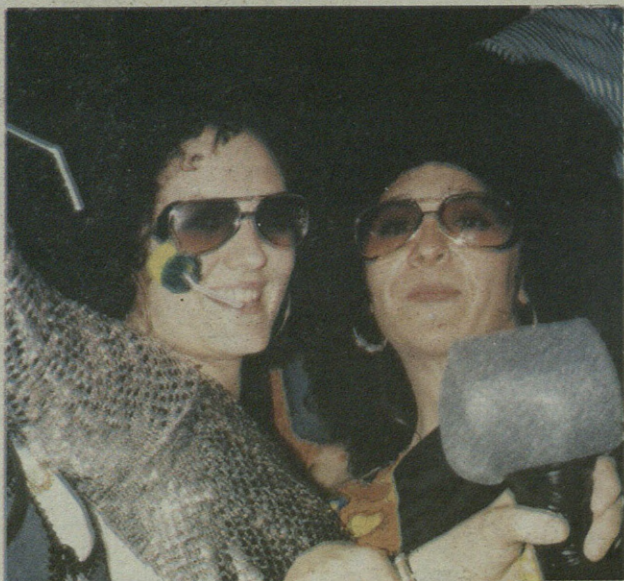
60ko hamarkadako moda aukeratu zuten bi lagunok.