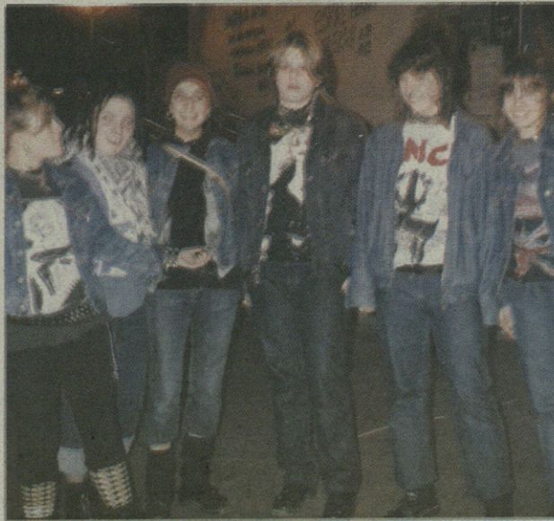
Horra, punku koadrila argazki kamerari begira dotore!