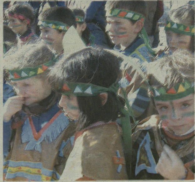
Umeek martitzenean berriro kolorea jarri zioten inauteriarri.