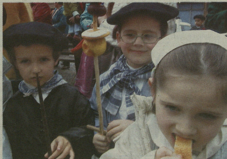
Urdelardero eguneko ohiturari ederto erantzun zioten umeek.