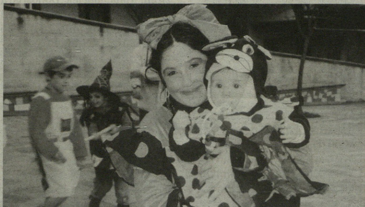
Hilabeteetako umea ere festan murgilduta ibili zen joan den zapatu arratsaldean.