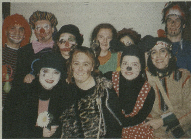
Saguak, pailazoak, indiarrak... denak elkarrekin ibili ziren jai giroan zapatuan.