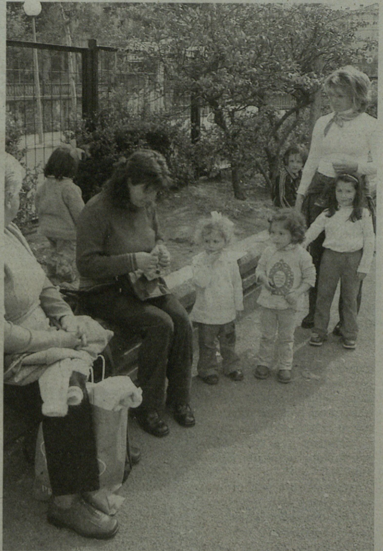
Seme-alabekin harremanak euskaraz izateko kanpaina bultzatu du Herri Eskolako Guraso Elkarteak.