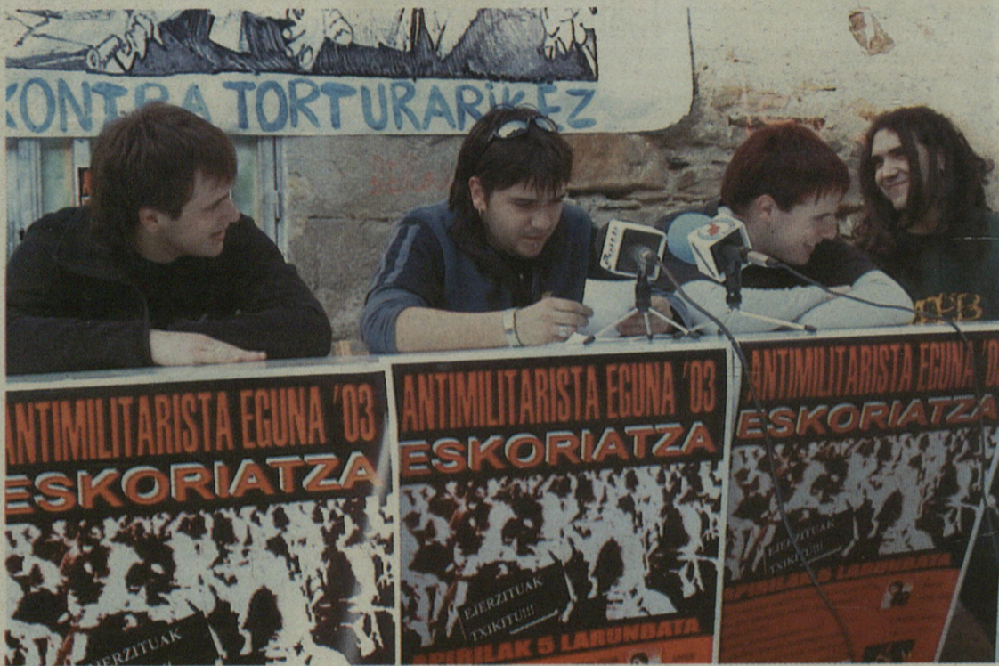
Gazte Asanbladak prentsaurrekoan aurkeztu zuen Antimilitarista Eguna ospatzeko gertatu duen egitaraua.

Antimilitarista Eguna garai bateko intsumiso taldeak sortu zuen. Gerora, soldadutzaren profesionalizazioaren ondorioz, egun hori Udaberri Festa bilakatu zen. Edozelan ere, soldadutza desagertu den arren, Gazte Asanbladak gogorazi gura du militarrek oraindik lanean dabiltzala. Eta horretarako Antimilitarista Eguna izenarekin aurkeztu dute urtero udaberri hasieran egiten duten festa handia. Horixe adierazi zuten Gazte Asanbladako ordezkariak martitzenean egindako prentsaurrekoan. Horrez gainera, jakinarazi zuten Antimilitarista Egunak Irakeko eraso legez kanpoko delat aldarrikatzeko balio izango duela. Hala, esan zuten bihar, zapatua, gerraren ordez festa egingo dutela Eskoriatzan.