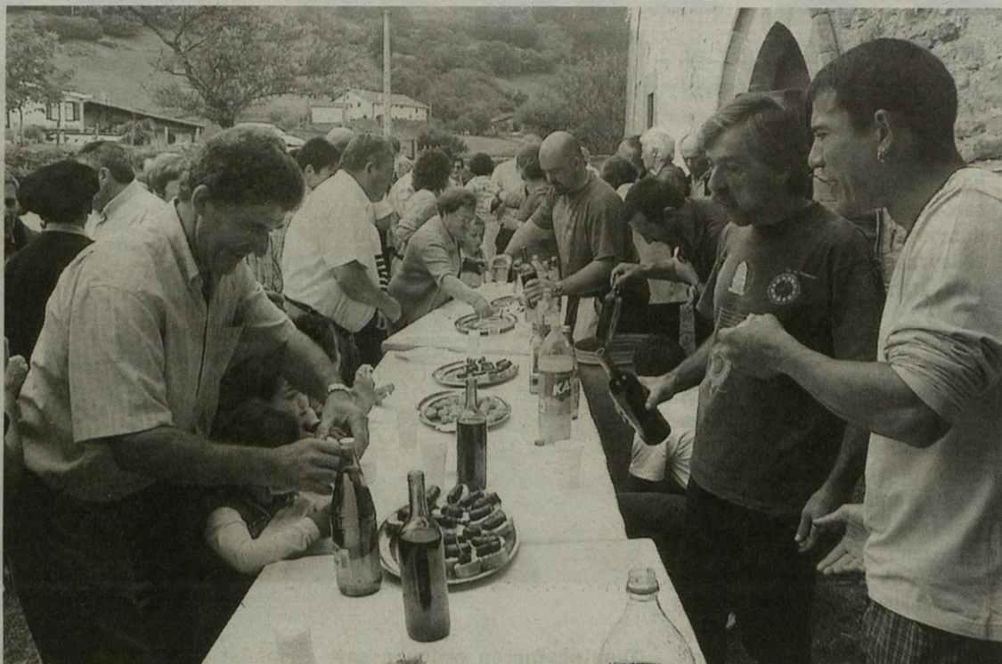
Meza entzun ondoren, Udalak prestatutako luntxaz gozatu zuten; eta gero, herritar askok laukora edo dokean jokatu zuten.