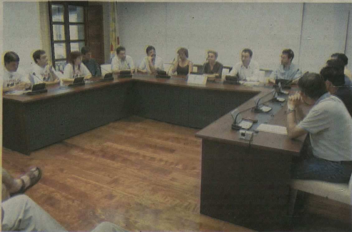
Plataformako kideek, ekainaren 14an izan zuten moduan, dagokien lekua izan gura dute bilkuren gelako mahaian.

Jorratu dituzten beste gai batzuen artean, udal taldeetako bozeramaileak izendatu dituzte.