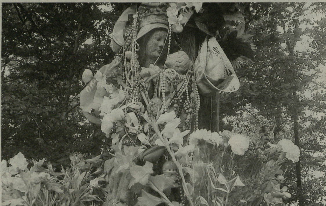
Dorletako Amaren omenezko 25. txirrindulari lasterketa antolatzeko urtarrilean hasi zen herrian batzorde bat lanean.

"Batzordearen gogoia gurean txirrindularitza berriro indartzea da"