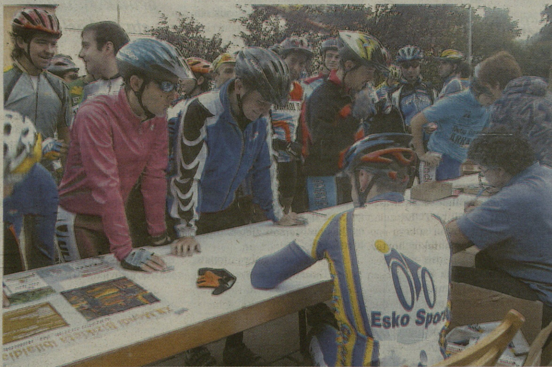
43 kilometroko ibilbidean ibarreko eta kanpotik etorritako ahalik eta txirrindulari gehien elkartu gura dituzte antolatzaileek.

Aurtengo ibilaldiak 43 kilometro izango ditu: "Bolibarrera joango dira lehenengo, eta Aitzorrotz, Bentafría, Jarindo, Albiña, Kurtzeta eta Asentzotik behera,