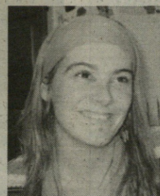
"Gatzagan koadrila berean ibiltzen dira ume guztiak"

Bremen-eko musikariak izeneko ipuinaren bertsio bat gertatzeko asमतan nabil.