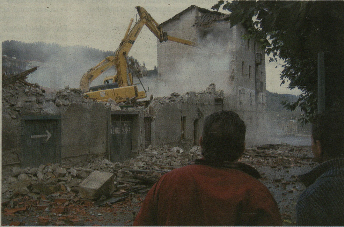
Eraispenean lanak martitzenetik eguaztenera bitartean egin zituzten, eta tarte horretan errepeidea itxita egon zen.

Gaztañaduiko eraikinen eraispenean herriko historia zatitxobat bota dute. Zorionez, baina, ez guztia; izan ere, Zubiateko labe ospetsua, monumetu historiko izendatua, bere horretan utzi dute. Alkatearen esanetan, eraispenean lanak egin aurretik labea Ibarraundi baserri ondora eramatea