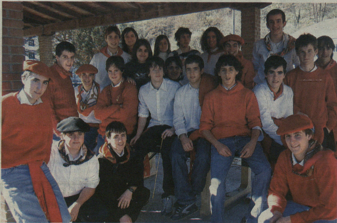
Santa Ageda bezperan, baserri baserri ibili ziren kantuan. Bazkal ordurako, nekeak jota zeuden guztiak.