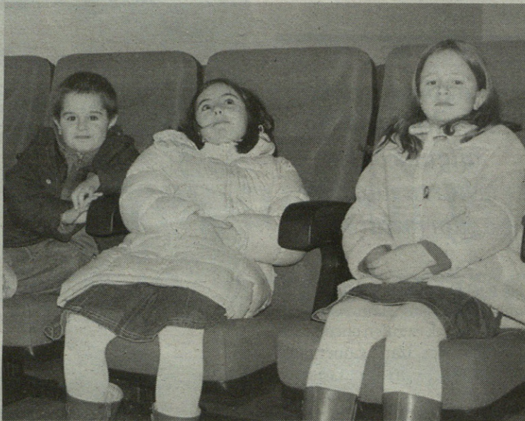
Filma ikusten duten bitartean gazteek ezin izango dute litxarreriarik jan aretoan.