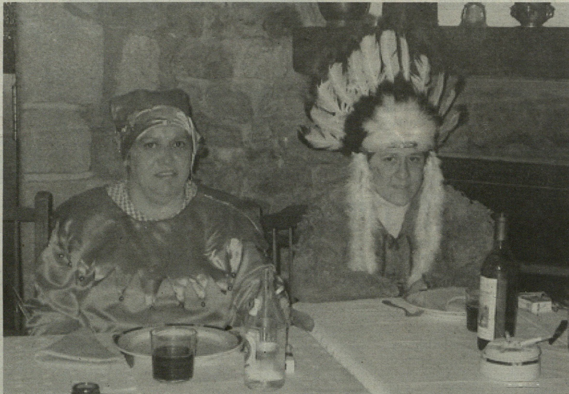
Aurten ere afarira mozorrotuta joatea eskatzen diete gatzagarrei Inauterietako giroan hobeto sartzeko.

Horren ondoren, herri txikiteoan parte hartzeko deialdia egin