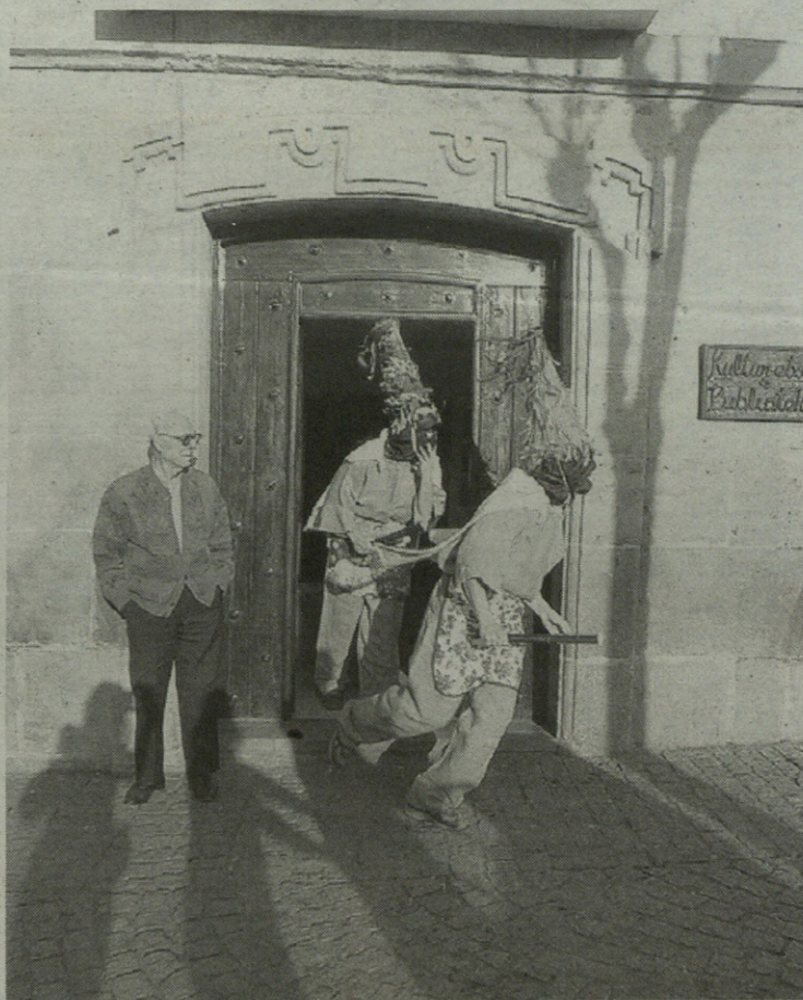
Urdelardero Inauteriak iragartzen ditu. Martitzenean Kukumarroak egongo dira.

Egun horrek badu bere esanahia. Lardero hitza latinetik dator, eta koipea esan gura du euskaraz. Egun horretan txerriak zergatik eskatzen zen jakiteko, Aratusteen ondorengo datari begiratu behar zaio. Kristautasunak era guztietako penitentzi, sakrifizio, zigor eta barauz osatutako denbora-tartea ezarri zuen, Garizuma, alegia. Horren aurretik, oreka bilatu guran, Inauteriak ospatzen hasi ziren, Garizumaren esanahiaren aurkako ekintzez osatzen zirenak. Horrela, ulergarri egiten da haurrak txerriki eske irtetea. Hala ere, gauzak aldatuz joan dira, eta gaur egun, txerriki barik, gozokiak jasotzen dituzte trukean herriko gazteek.