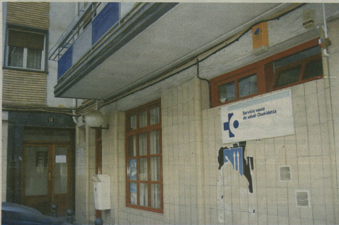
Gaur egun Santa Ana kaleko osasun etxean baino zerbitzu gehiago eskainiko ditu egoitza berriak.

Herrian dagoen osasun etxea txiki-geratu da Eskoriatzako biztanle guztientzat. Hori dela eta, Udalak bereak ziren lur batzuk eman dizkio Osakidetzari. Baina metro koadro guztietatik, 45 partikular batenak ziren. Hala, harekin akordioa egin, eta azkenean, osasun etxe berrirako erabiliko dituzte lurrok.