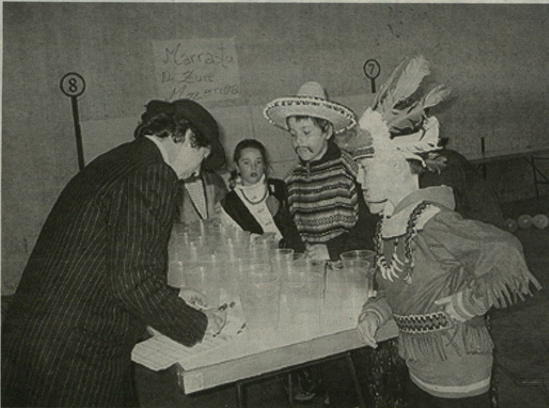
Nahiz eta hotz egin, antolatutako jokoetara gazte ugari hurbildu zen zapatuan: indiarrek, mexikarrek...

Ondoren, helduen txanda iritsi zen: txikiteoa egin zuten, afalordura arte. Bukatzeko, denek batera Ostatun afaldu zuten, eta Aretxabaletako Basabek giroa alaitu zuten musikarekin.