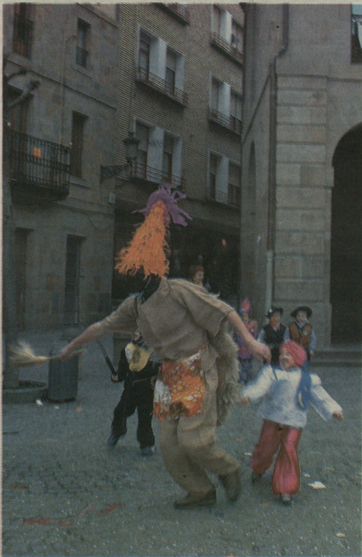
Kukumarroak zirikatzen aritu ziren martitzen arratsaldean.

Martitzenean, besteak beste, 'sorgintxoak' eta 'erletxoak' ikusi genituen