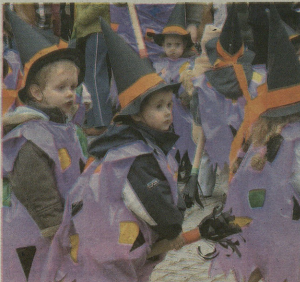
Erratz alderantziz härtuta egiten du hegan sorgintxo honek!