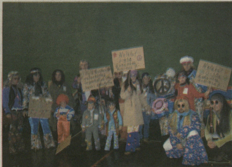
Hippy-ek errebindikazio mordoia egin zuten euren jaietan.