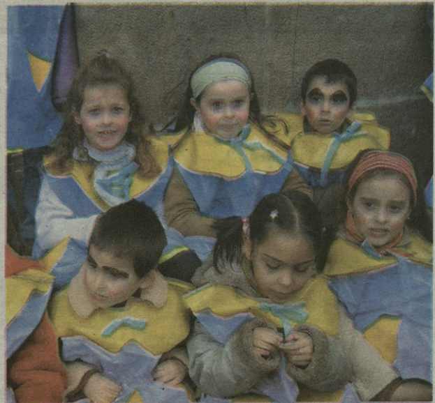
Shin Txan mordoia ikusi genituen Eskoriatzatik bueltaka.