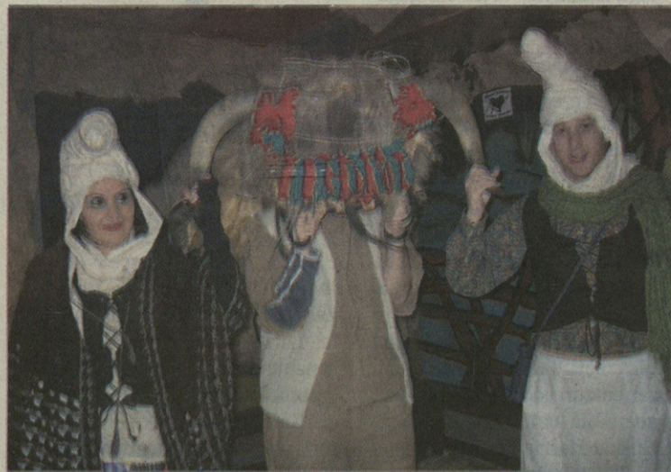
Inkernu taberna sorginek irabazi zuten mozorrotutako tabernen lehiaketa.