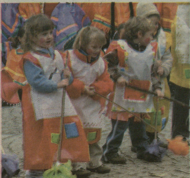
Erratzek bikain dantzatu eta erratzu zuten plaza.