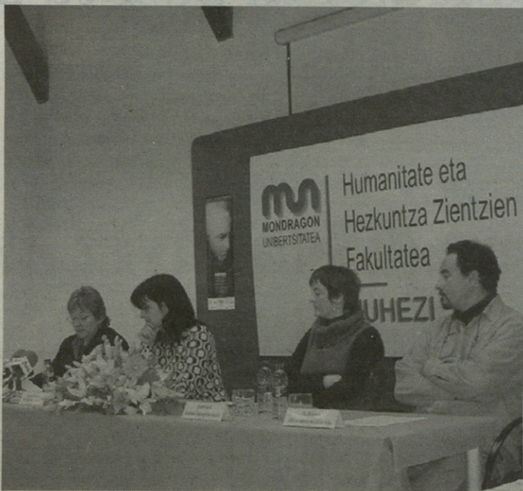
Antolatzaileek prentsurrekoan aurkeztu zuten aurtengo Literatura Astea.