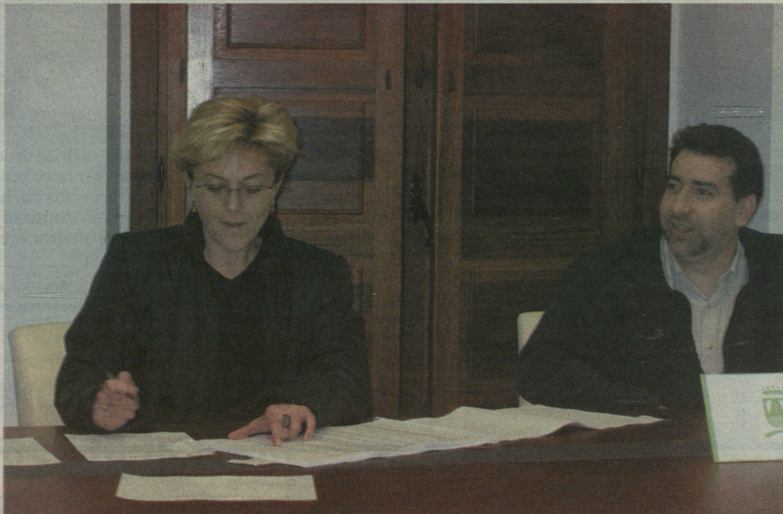
Emakume eta gizonen arteko berdintasuna eskatzeko mozioa eta presoek eskubideei dagokiona onartu zuten osoko bilkuran.

Aurkeztu zuten dokumentuan, oraindik gaitzitu beharreko hainbat gai daudela adierazi zuten. Horrela, emakumeak lan mundura sartzeko erraztasunak emateari eta genero biolentziaren