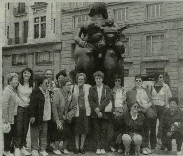
Iaz, Oviedo aldean ibili ziren Sorgina taldeko kideak, eta aurten Leonen.

Iaz 20 lagun izan zirena bidaia egitera animatu zirenak. Asturias aldean egon ziren aurreko irteeran, eta hara joandakoen esane-