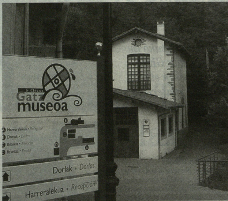
Gatz Museora bideratuko dute inbertsioen diru kopuru handiena.

Ura goiko ur-biltegitik herriraino jaitea da beste egitasmo bat; horrela, ureztaketa-hartune bat jarriko dute herrian bertan.