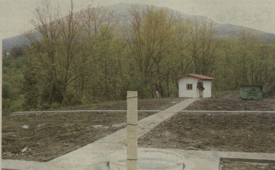
Almen gainaldean daude lurak, Torrebasoan. Udalak bost urtetarako utziko dizkie erretiratuei.

Torrebasoko hiru lursailetan 19 partzela daude, eta bakoitzak 60 metro koadro ditu. Gainera, erretiratuek beraien tresnak uzteko toki baten premia jabetuta, Udalak txabola bat eraiki du lursail horietan. Txabolan, nork bere armairua izango du.