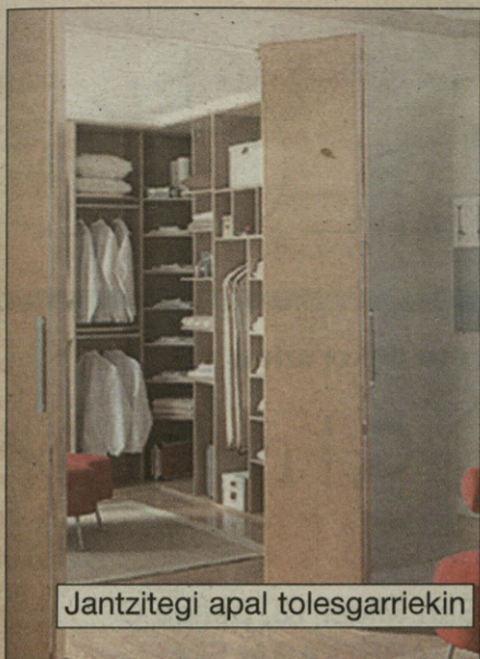
Jantzitegi apal tolesgarriekin