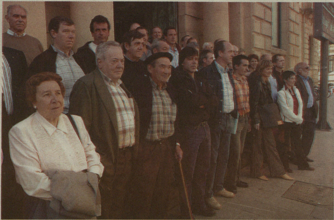
Herriko hainbat kaltetu Donostiara alegazio epea luzatzeko eskatzera joan ziren apirilaren 26an.

Baina ez da egin duten salaketa bakarra. Izan ere, Aldundiko ordezkariak berandu etorri dira herrira; beraien ustez, kaltetuen deiari erantzuteko denbora luzeegia behar izan dute. Gai-