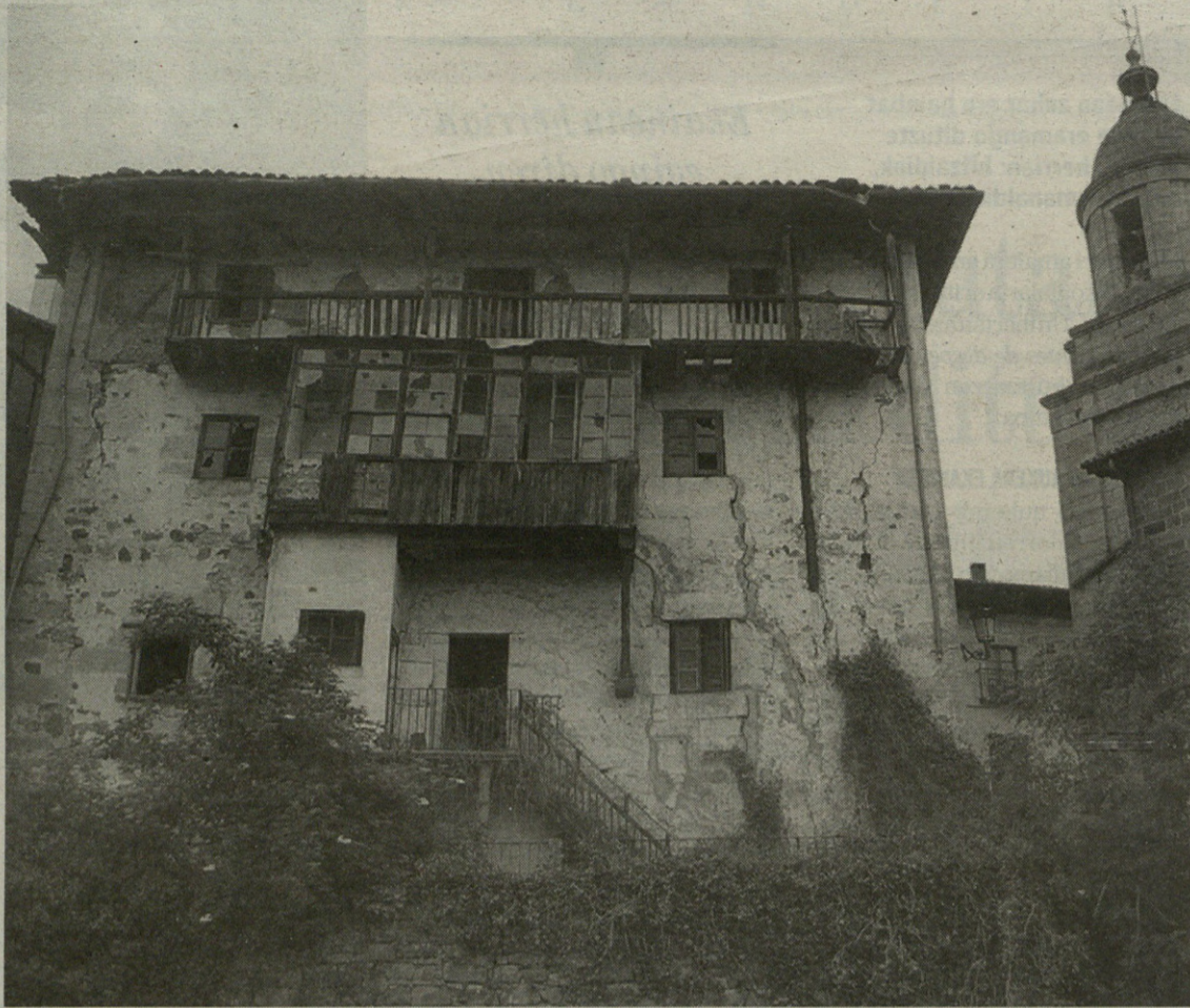
Zein erabilera emango zaion zehazteke dago oraindik, baina ez dute ideiarik baztertzen.