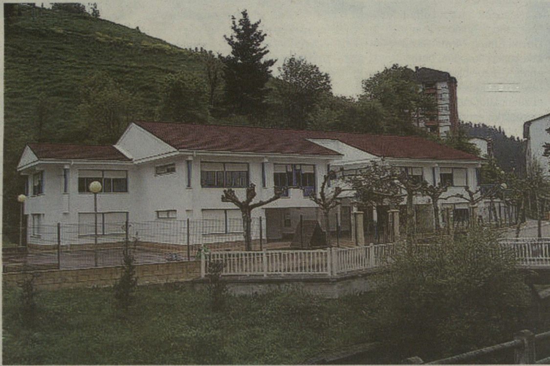
Langile bakarra dago orain Eskoriatzako Bibliotekan; haren laguntzaile izateko deialdia egin du Udalak.

Naziotasun espainiarra izatea ezinbestekoa da, eta 18 eta 32 urte bitartean edukitzea. Gutxieneko