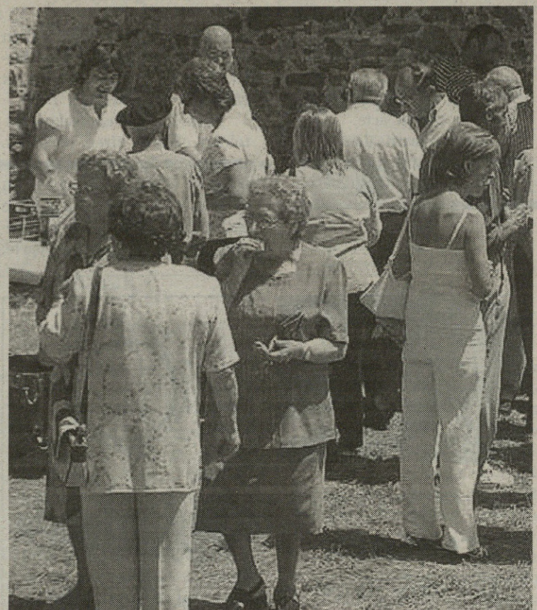
Eguzkipean mokadutxoa jateko aprobetxatu zuten bertaratutakoek.