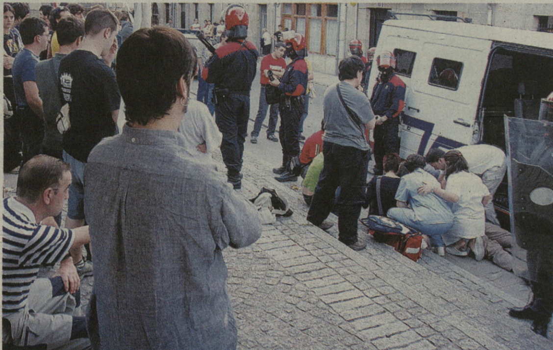
Astleheneko zauritua lurrean, ertzainen begiradapean, erizainak zaintzen ari direla.

Astlehenean jende mordoak elkartu zen, bereziki Marixolen