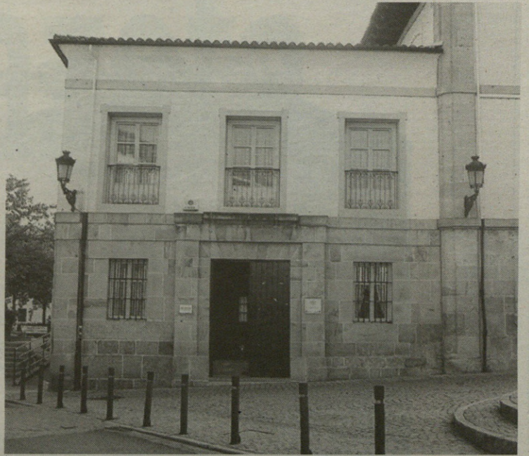
Herriko plazan dago Eskoriatzako Bake-epaitegia.

Lanpostura aurkezteko hainbat baldintza bete behar dira: adinez nagusi eta Espainiako nazionalitatea izatea; lanean diharduen abokatu edo prokuradorea ez izatea eta kargu politiko sindikalik ez betetzea, esaterako. Informazio gehiago, Udaletxean.