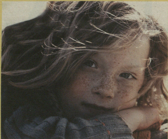
Boboli jaka HAURRAK UMEEN MODA Lezama zentro komertziala 15 Aretxabaleta