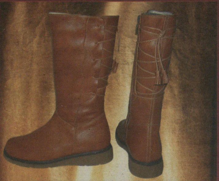
Neskentzako botak M a CARMEN OINETAKOAK Errekabarren 22 Aretxagazeta