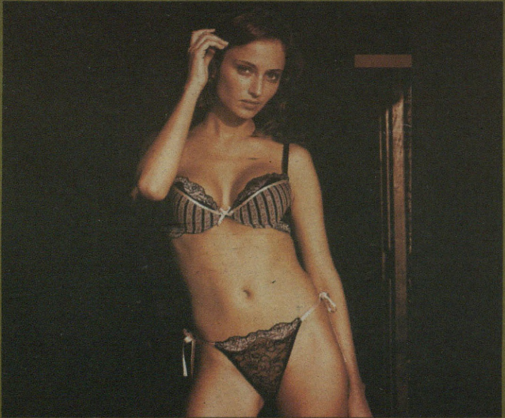
Passionata barruko arropa XARMANTA OPARIAK Gaztainadui 21 Eskoriatza