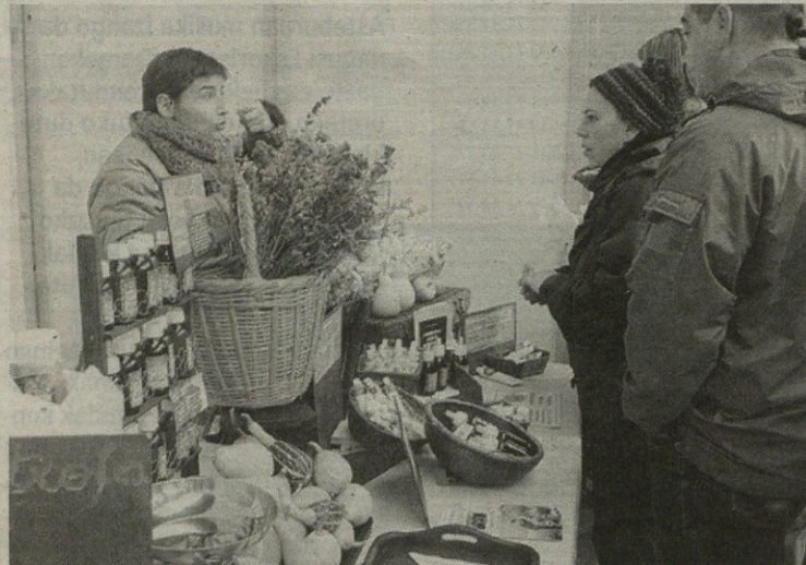
Produktu biologikoek jendearen arreta pizten dute.