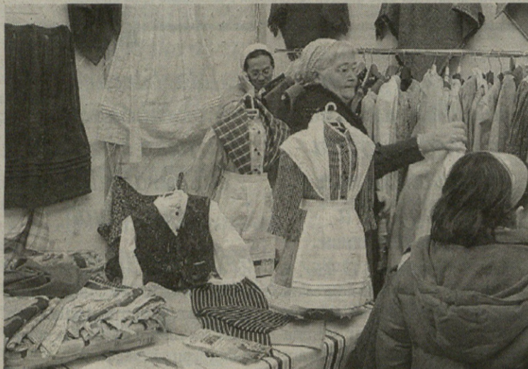
Askotariko euskal jantziak ikus zitezkeen domekan Gatzagan.