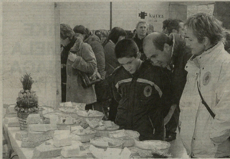
Familian gerturatu ziren asko domekan Gatzagara.