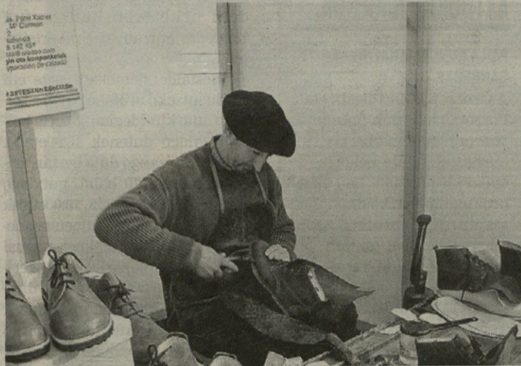
Zapataria lan eta lan aritu zen jendearen begiradapean.