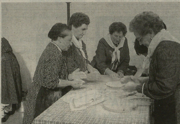
Sorginek ez zuten lan gutxi izan domekan denentzako janaria prestatzen!