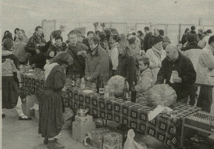
Askok berotu zuten gorputza salda bero-beroarekin.

Horri aurre egiteko, hogeita bi sorginek prestatutako 80 kilo talo, 30 kilo txistor, hamar kilo hirugihar eta salda beroa zuten zain pilotalekuan bertan. Baina bazuten edateko besterik ere; sagardoa, ardoa eta txakolina hartu zuten, bisitariak asko izan ziren eta. Trikitilariak ere lan polita egin zuten domekan, euren doinuek azoka girotzeko balio izan zuen-eta. Bisitari gehienak oso gustura geratu ziren domekan ospatutako San Milixan ferian ikusitakoarekin.