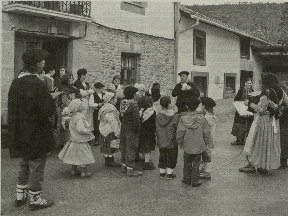
Abeslari finak direla erakutsi zuten gatzagarrek.

Bestalde, kanpora ere egin zituzten irteerak. Gasteizera joan ziren eta, bide batez, Florida parkean jarritako jaiotza ikusi zuten. Bestalde, errege kabalgata Gatzagan egiten ez denez, urtarrilaren 5ean Aretxabaletara egin zuten txangoa guraso eta seme-alabek.