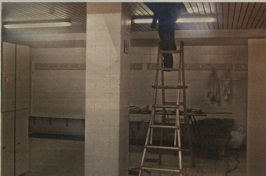
Ura legionella mikrobioetatik babesteko neurriak hartu eta hodiak aldatu dituzte.

Eskoriatzako Udalak hirigintza hobekuntza plana egitea aurreikusitua zuen 2004. urte hasieran. Zenbait hilabetetan herriko barrutietako hainbat auzokiderek bildu, eta haiek euren ekarpenak egin zituzten. Inbertsio handirik behar ez duten askotariko lanak egingo dituzte. Hasieran pentsatutako lan batzuk dagoeneko amaituta daudela eman dute aditzera Hirigintza Saileko arduradunek. Herriko zenbait toki hobetzeko lanen aurrekontua auzoka banatuta dago. Hala, San Pedro eta Intxaurtxuetara 56.036,86 euro, erdialdera 37.201,55 euro, Dorletara 14.482,87 euro eta Aranburuzabala eta Olaetara 23.871,02 euro bideratzea adostu zuen Udalak. Guztira, beraz, 131.592,30 euro erabiliko dituzte. Besteak beste, San Pedron baldo-