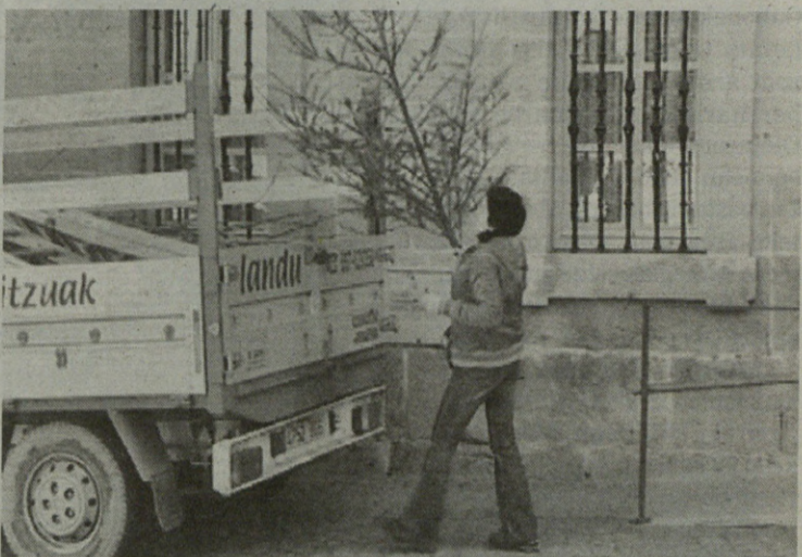
Goian, marrazki lehiaketako saridunak eta behean, batutako zuhaitzetako bat.