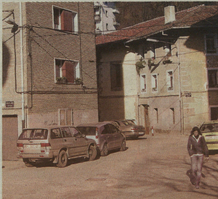
Oinezkoentzat toki gehiago jarri gura dute Santa Anan.

Beste gai batzuk ere landuko dituzte astelehenean. Horietariko bat izango da Bake Epaille Titularri buruzkoa. Izan ere, nahiz eta orain hilabete batzuk lehiaketara irten zen, hutsik geratu da postua.