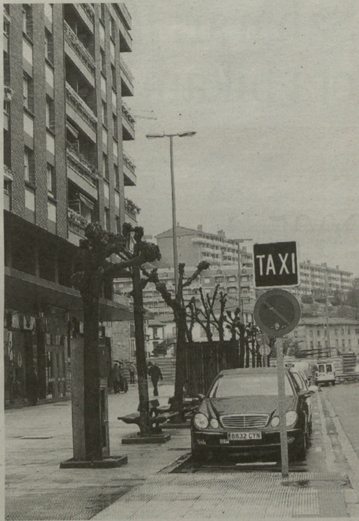
Arrasaten, esaterako, taxiak egunez eta gauez egon daitezzen saiatzen dira.

Bestalde, taxien elkarteak eskatu du udalek lizentziarik eman ez ditzala. Horri ere baiezkoa eman dio Eskoriatzako Udalak, betiere herritarrei eskaini beharreko zerbitzua behar bezala ematen bada.