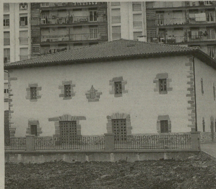
Erabilgarri dago dagoeneko lehen solairuko hitzaldi aretoa.

Bestalde, nahiz eta museoa herriko historia ezagutzeko lekua izan, informazio-gune izatea ere gura dute arduradunek.