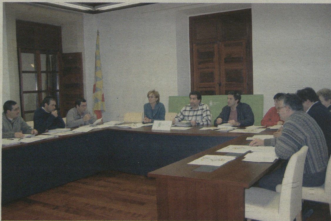
Dokumentuen berretiketatzak lanak amaitu arte mailegu sistema etentzea dakar.

Eskoriatzan egingo diren inbertsio handienak hiru dira: alde batetik, Santa Ana urbanizazioa egiteko milioi bat euro bideratuko dute; bestetik, Dorleta auzoa birgaituko dute Izartu programak emandako diruari esker, eta hainbat lokal egokitu.