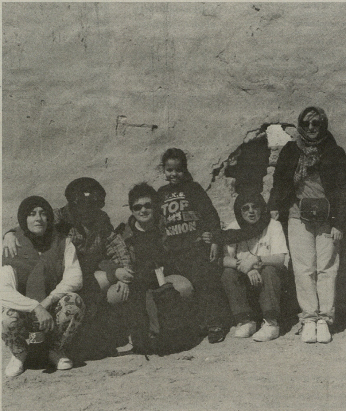
Lotura estua dute hainbat gatzagarrek Saharako biztanleekin. Irudian, 2002. urtean bertara egindako bidaia.

Nubi Arrasateko Sahararren Lagunen Elkartea da eta hainbat ekimen egin ditu herri hartako errefuxiatuen alde. Azkena abenduan abiatu zuen elkarre solidarioak; sahararrentzat elikagaiak