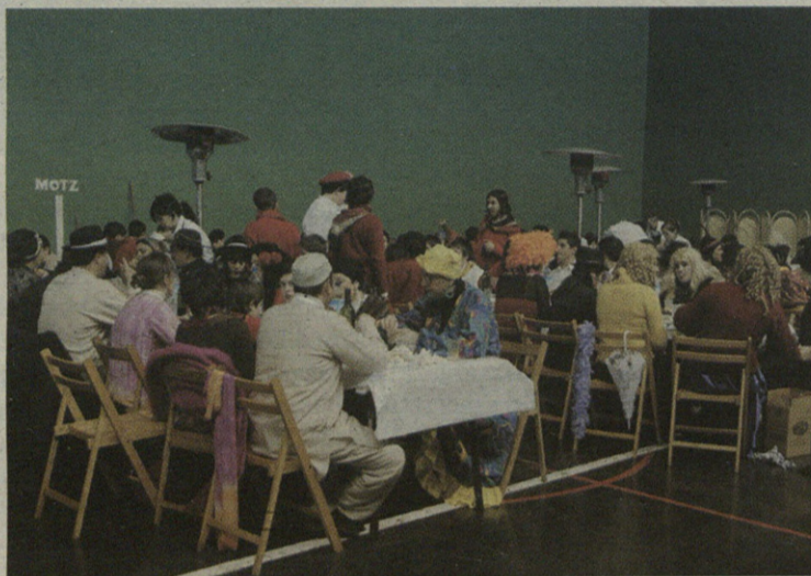
Zapatuan jai giroa nagusitu zen pilotalekuan, herri bazkarian.