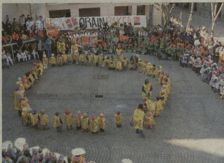
Herriko Plazan ederto egin zuten dantzan ikastetxeetako lagunek.