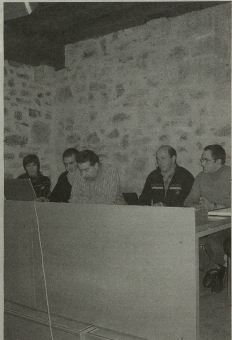
Itxieraren kontra daudela adierazi zuten parte-hartzaileak.

Baserritar, harakin, eta abarrek hainbat kezka azaldu zuten hizlariari. Hala ere, guztiak bat agertu ziren hiltegia kosta ahala kosta zabalik mantentzea gura dutela.