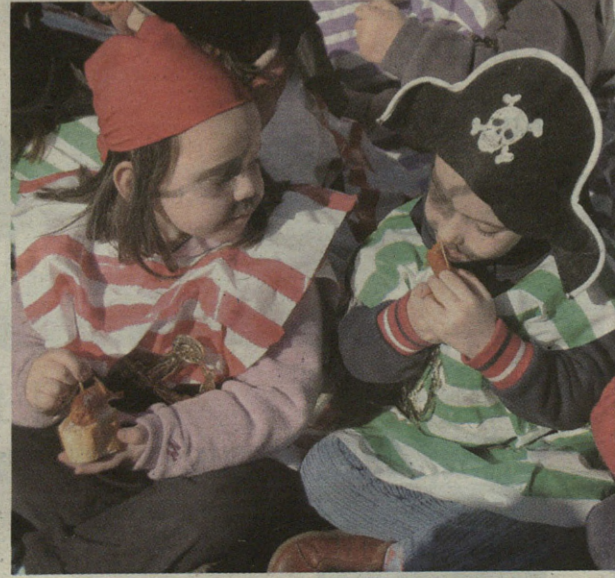
Piratek ez zuten txistorrarik lapurtu behar izan oraingoan.