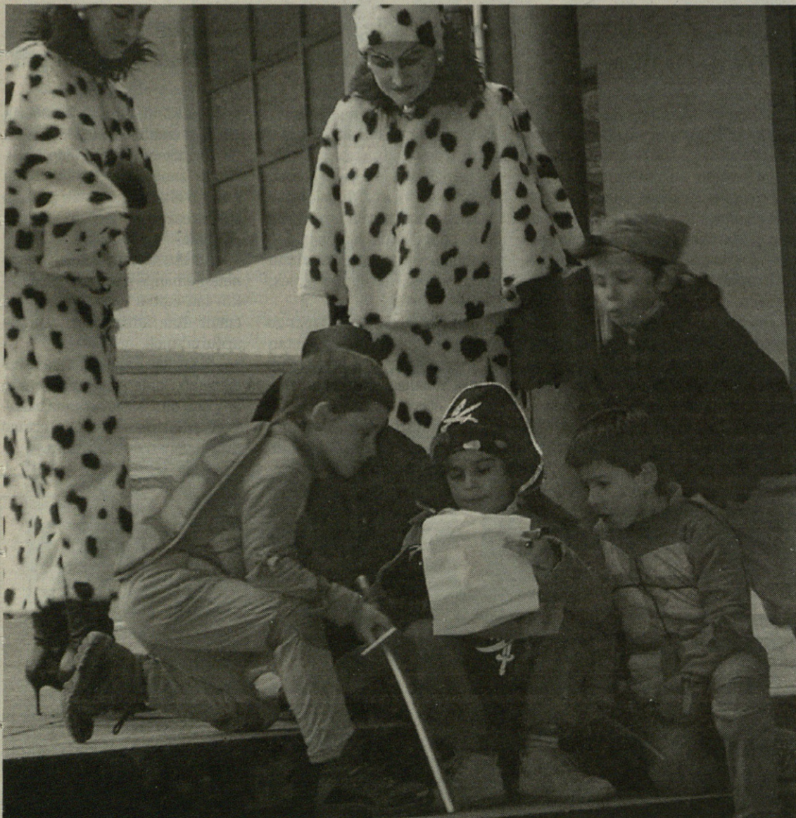
Mapak irakurtzeko abilezia erakutsi zuten altxorraren bila aritu zirenek.