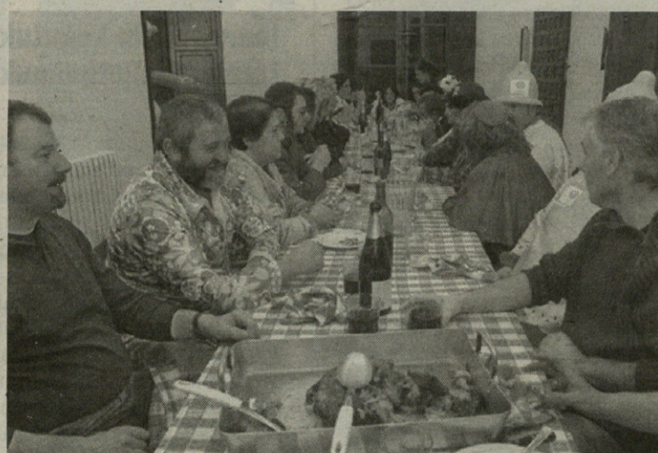
Nagusiek afaltzen amaitu bitartean...