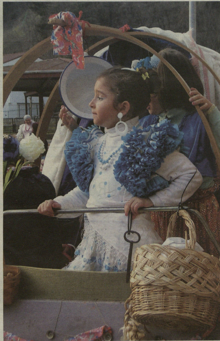
Andaluziatik gurdian etorritako neska ote?