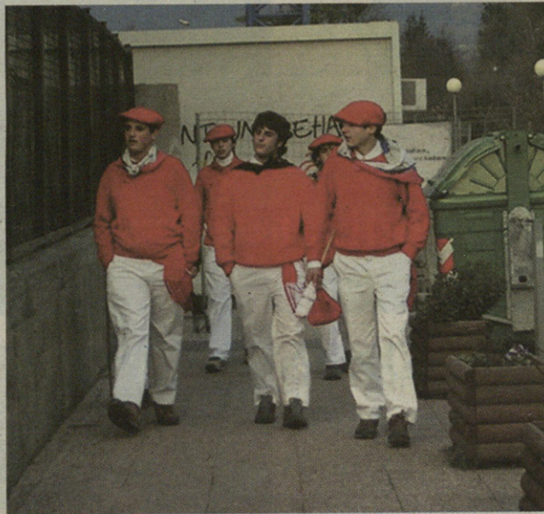
Lan handia egin dute kintoek Inauterietan.