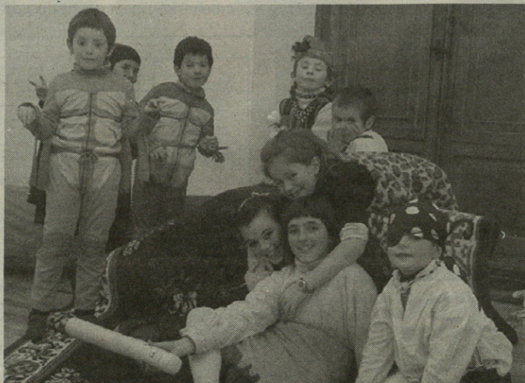
...elkarrekin jolas egiteko aprobetxatu zuten gazteek.