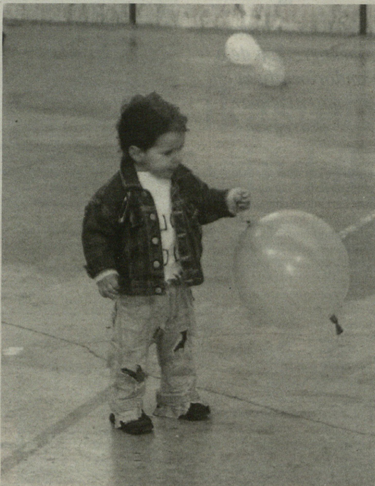
Punk txikia ere gerturatu zen zapatuan herrira, eta ederto ibili zen.

Asteburuan Gatzagan egon zen ZE BARRIko irakurle batek ohartxo bat emateko eskatu digu. Batetik, eskerrak eman gura dizkie herriko gurasoei, gazteentzako jolasak antolatzeagatik; bestetik, Udalari ere eskerrona eman gura dio afaria eta dantzaldia prestatzeagatik. Ederto ibili zela gaineratu du.