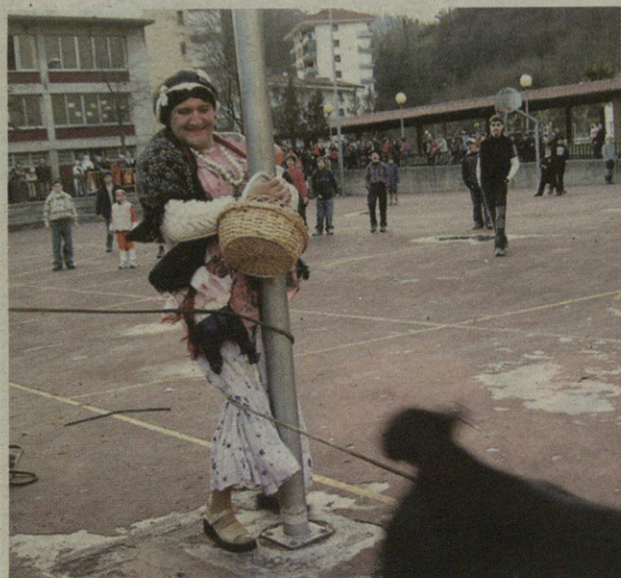
Araoak izan zituen emakumeak sokarekin.