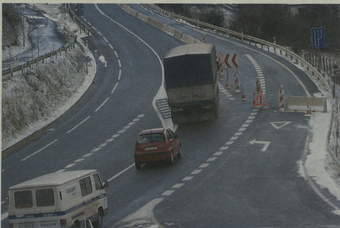
Ezkerreko bidea itxi dute gorako norabidean tuneleraino lurra hondoratzen ari zen eta.

Konponketa lanak datozen asteotan hasiko dituztela eman dute aditzera Udaleko arduradunek, "nahiz eta oraindik eguna zehaztu gabe egon", azaldu dute.