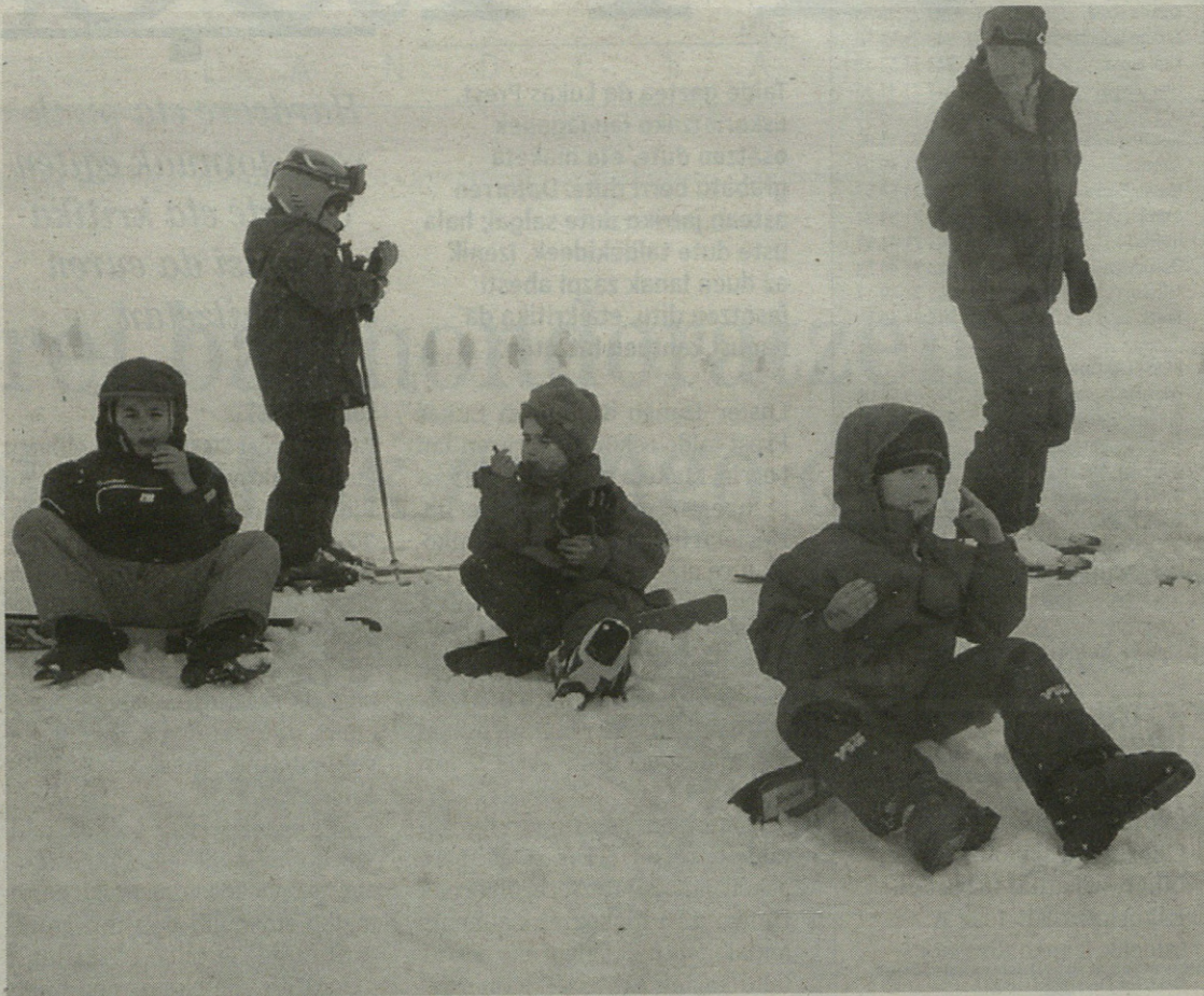
Eskiatzeko gogo handia dute herriko gazteek eta gaurko bileran gauzak konpontzea espero dute gurasoek.

Printzipioz ez dute bidaiaren eguna aldatu; zer egin erabakitzeko bilera egingo dute gaur