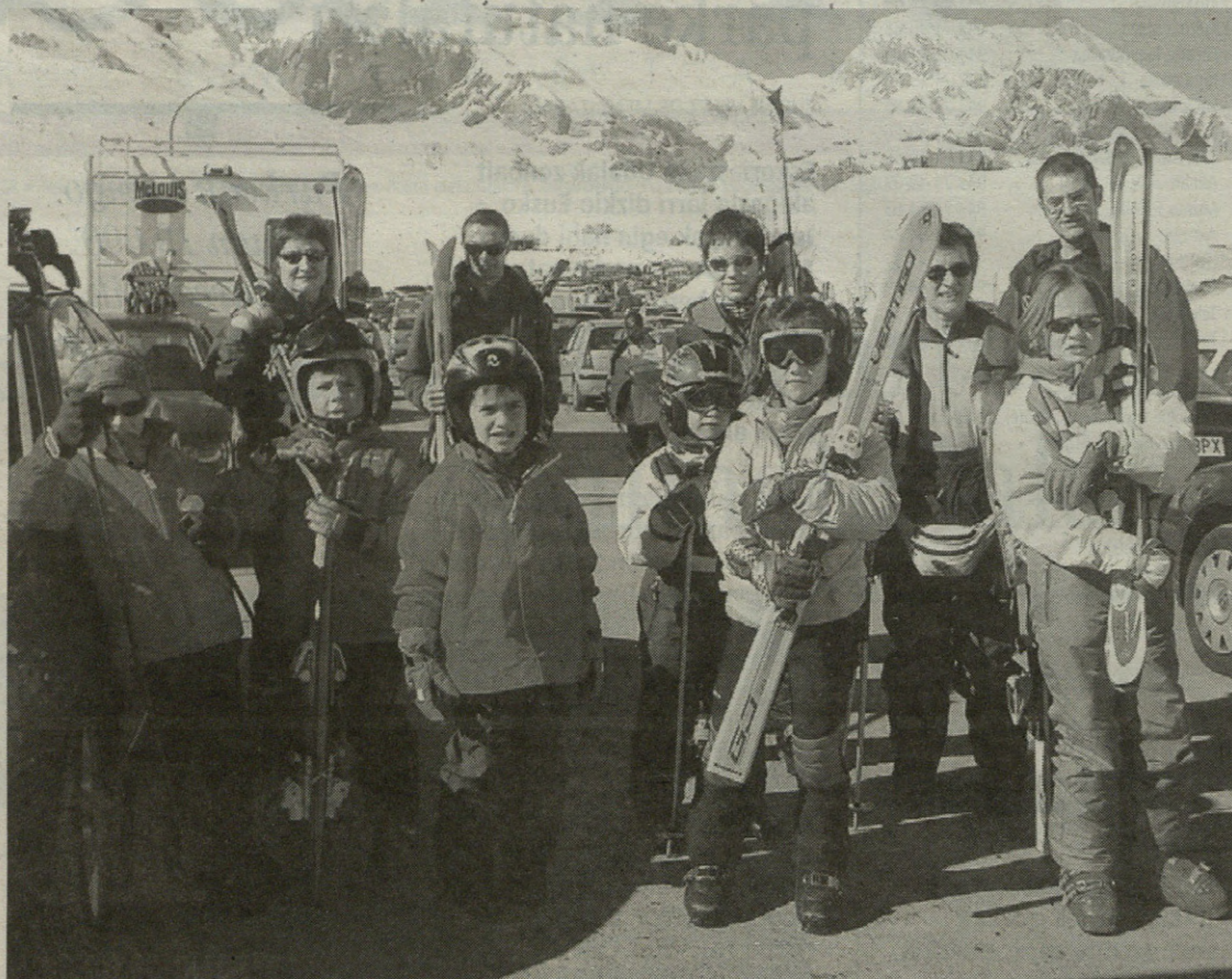
Izugarrizko gogoa zuten eskiatzera joateko eta primeran igaro dutela eman dute aditzera.

Leintz Gatzagako ludotekan alda- keta bat egin dute Guraso Elkar- teko lagunak. Egunean bi orduz ire- kitzen dute Garro jauregian dago- en lokala, 17:15etatik 19:15etara. Orain arte lehenengo ordua naga- siek erabiltzeko zen eta bigarren ordua, berriz, gaztetxoek era- biltzeko. Orain, gura dutenean joan daitezke Leintz Gatzagako gazteak ludotekara jolastera.