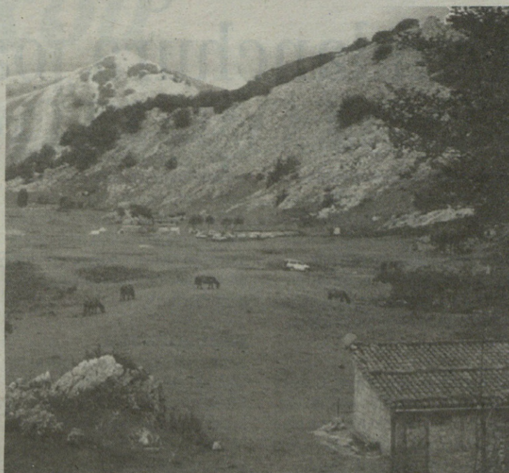
Degurixa aldea ere parkearen baitan sartuko da.

Bestalde, parkearen mugak berrikuskatzea eskatu diote Eusko Jaurlaritzari. Mugak zenbait lursailetatik igarotzen direla azaldu dute. Hori dela eta, ahalik eta errespetu handien izateko eskatu dio gobernuari alegazioetan udalbatzak. "Oraingo planteamenduarekin mugek bat egiten