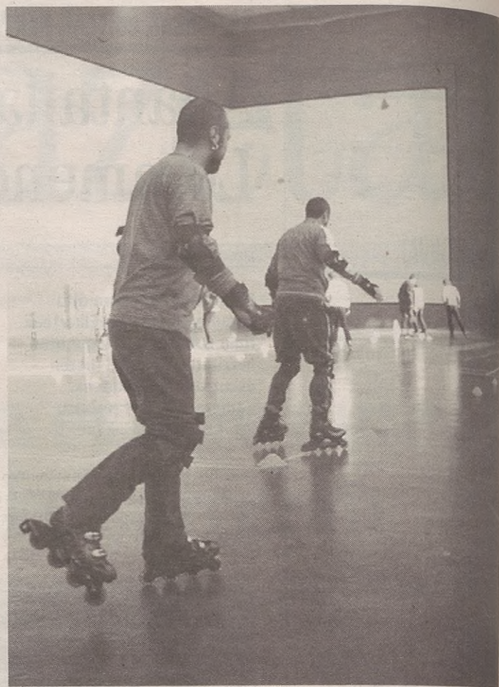
Izugarritzko arrakasta izan zuen aurtengo lehen ikastaroak, 35 lagun ibili ziren.

Lehenengo ikastaroan 35 lagun ibili ziren; 19 hastapen mailan, eta 16 hobekuntzan