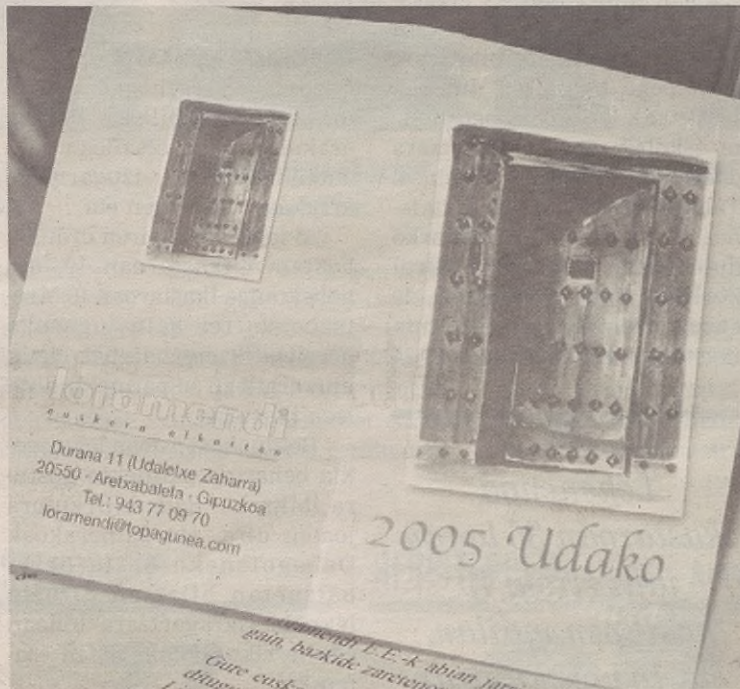
Aprila eta ekaina bitartean antolatutako ekintzak aurrera doaz.

Datorren egunean, maiatzak 5, hartzaren gaineko berbaldia egin-