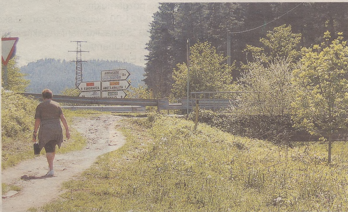
Arrasateko bidegorrira joateko errepidea gurutzatu behar dute oinezkoek; benetan arriskutsua zenbat auto dabilen ikusita.

Herritar asko ibiltzen da Aretxabaletatik Arrasatera joan-etorrian lehengo trenbidea aprobetxatuta. Arrasaterantz egiteko, baina, errepidea pasatu behar da, eta oinezkoak asko badira automobilak izugarri. Orain arte istripu larririk gertatu ez bada ere, gerta daitekeela ikusi zuten bi herrietako Udalek, eta kezka horiek azaldu zizkioten Foru Aldundiko Garraio eta Errepide Sailari bere garaian. Hala, gune horretako segurtasun arazoa konpontzeko asmoarekin LKS enpresari proiektua egiteko eskatu