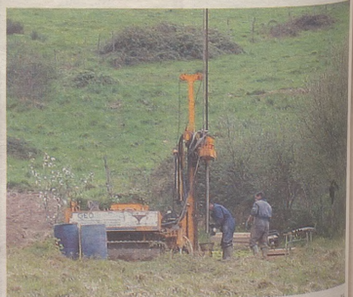
Zundaketa lanak egiten ibili dira azken bi hilabeteotan erreka osteko beste aldean.

Bestalde, CVL lantegia lekuz aldatzen dutenean 121 etxebizitza egingo dituzte bertan; prezio librea izango dute guztiek.