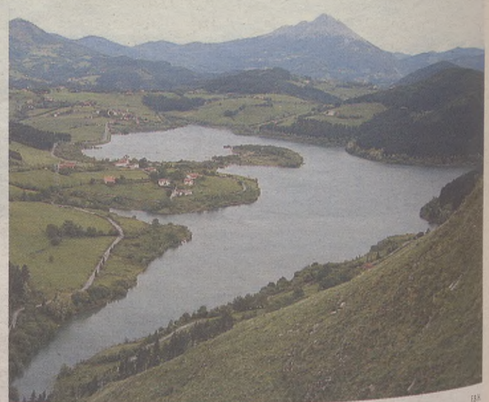
Lau ildo dituen egitasmoa dauka Udalak Urkulu urtegi ingurua biziberritzeko.

Lantalde horretan lau ildo ezarri zituzten: Urkuluko ur-bazterrak txukuntzea; Urkulutik Arantzazura dagoen bidea egokitu eta behar bezala seinaleztatzea; ur bazterrean dauden pinudien ordez bertako zuhaitzak landatzen hastea eta nekazari ingurua dagoen-tan mantentzeko behar diren neurriak hartzea. Poliki-poliki hasiko dira lantzen ezarri dituzten ildoak.