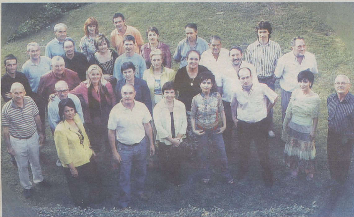
Gaur egun 30 kidek osatzen dute Aretxabaleta Abesbatza, eta parrokiako elizkizun nagusietan eta hiletetan abesten dute.

Erljio-polifonia eta euskal folklorea izan zituen ardatz lehenengo urteetan. Parrokiako jaie-