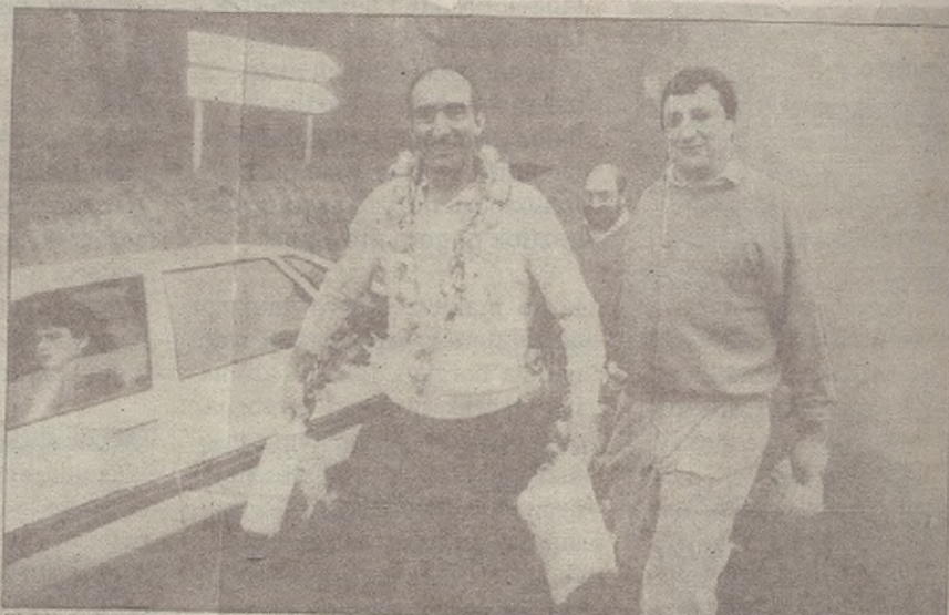
El frío, la lluvia y una baja niebla provocó en Urkiola un descenso de los visitantes en el día de San Antonio tal y como se ve en la imagen.

capitanesado por el soltero de oro, Juanjo Gasa-