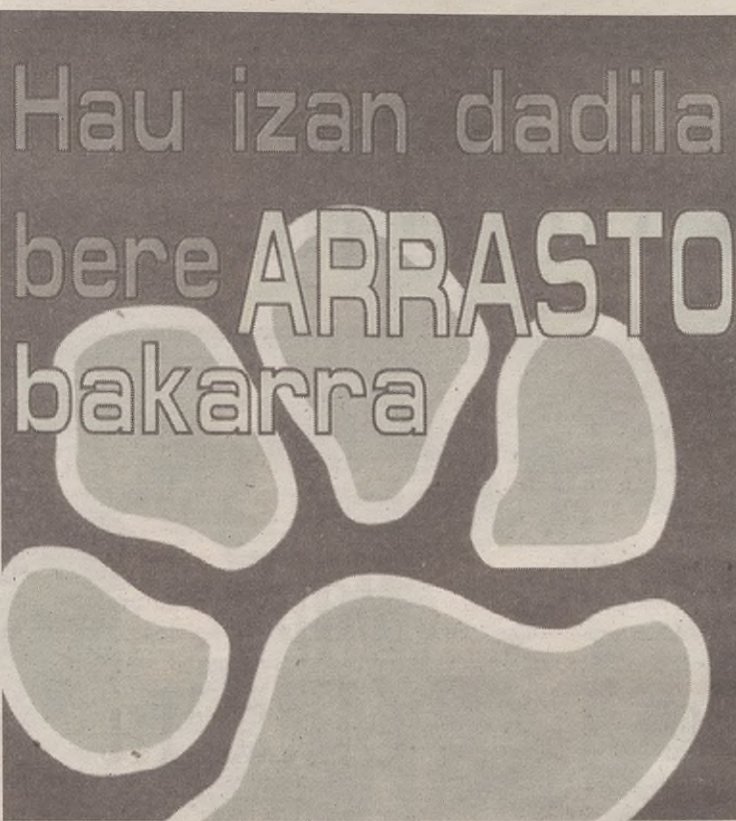
Arrasto bakarra oinatz izan behar dela gogorarazteko kanpaina jarri dute abian.