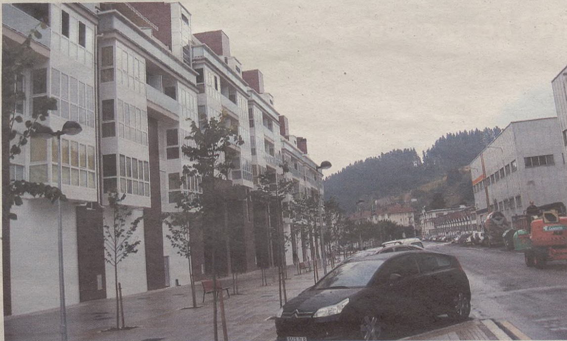
Iralabarri plazako hainbat etxebizitza Lucio Garai galdategitik 50 metro eskasera daude.

Ehun sinadura inguru batu dituzte Iralabarriko bizilagunak, eta udaletxean aurkeztu. 50 metro eskasera daukaten Lucio Garai galdategiak gauetan ez diela lorik egiten uzten diote, eta tximiniek botatzen duten hautsak etxeen aurrealdeak zikintzen dizkietela. Bizilagunen esanetan, Udalak ez du bere gain hartu gura arazoa, eta ez die erantzun zuzenik eman. Hori dela eta, eta batzuk lorik ezin eginda oso gaizki pasatzen dabiltzala ikusita, Arartekoarengana jo dute. Hark uste zutena berretsi die, Udalak hartu behar dituela zaraten kontra-