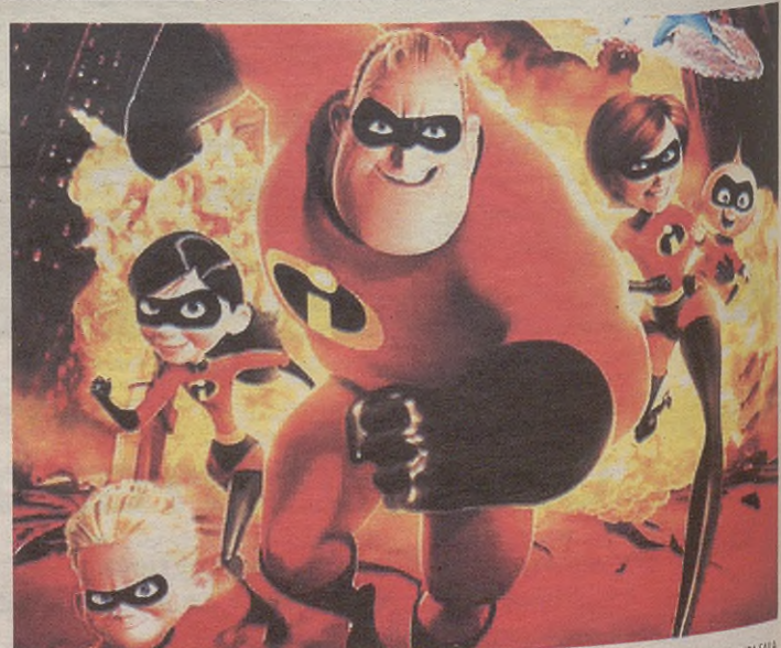
Los Increibles filma emango dute hilaren 26an, 22:30ean, herriko plazan.

Gaur, egubakoitza, Mar Adentro filma emango dute; martitzenean, hilak 12, Shrek 2 ; hilaren 15ean, Los chicos del coro ; hilaren 19an, Unibertsolariak munduaren ertzaren bila ; hilaren 22an, Diarios de motocicleta ; hilaren 26an, Los Increibles , eta bukatzeko hilaren 29an, Crimen Fectivo .