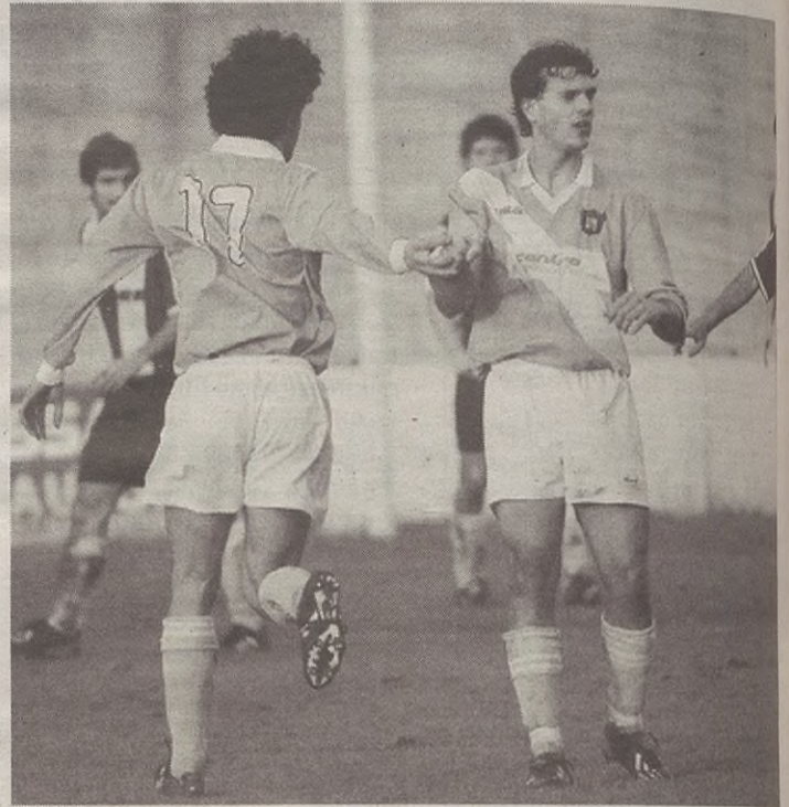
Astehenean hasiko da preferenteko futbol taldea entrenamendu saioetan.