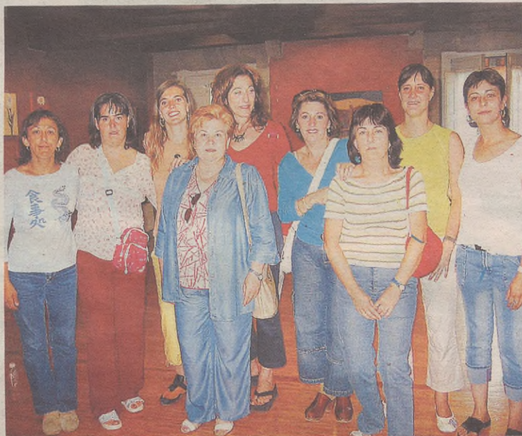
Aretxabaletan 22 langile inguru dabilta lanean Gizadi enpresaren eskuetan.

Herriko gaixo eta edadetuak zaintzen dituzten langileek egiten