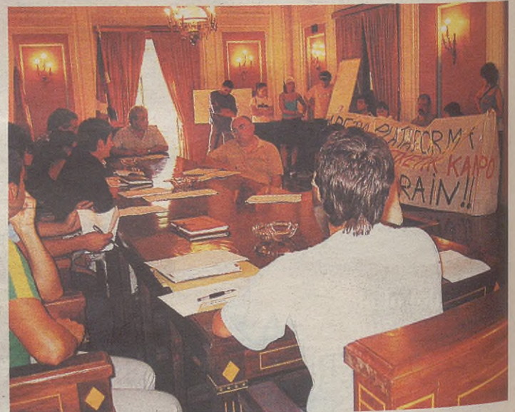
Azken hilabeteetako osoko bilkura guztietan izan dira Aretxa plataformako kideak

Udal langileen lanpostuen balorazioa egin du oraintsu LKSk, eta osoko bilkuran onartu zuten uztailaren hasteko aplikatzen. Hala, postuak baloratzeko irizpideak ezarritu utzi dituzte, eta funtzioak zehazten dituen liburuxka egin dute. Aurtengo soldata igoera ere zehaztu zieten langileei, Eudelek proposatutako 2,5, hain zuzen.