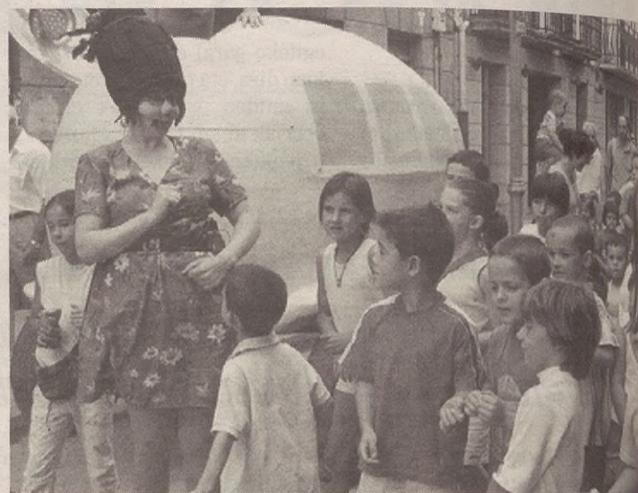
Umeak jaietan beti gustura, eta aurten gazteek ere badaukate zela pasatu ondo.

Bi omenaldi ekitaldi egingo ditu Udalak. Batetik, Aretxabaleta Abesbatzak 25 urte bete dituela eta jaiari hasiera emango die abuztuaren 14an, 19:00etan; bestetik, Agustindar elkarteak 100 urte egin dituelako Aretxabaletan esker ona adieraziko dio Udalak abuztuaren 15ean mezaren ostean.