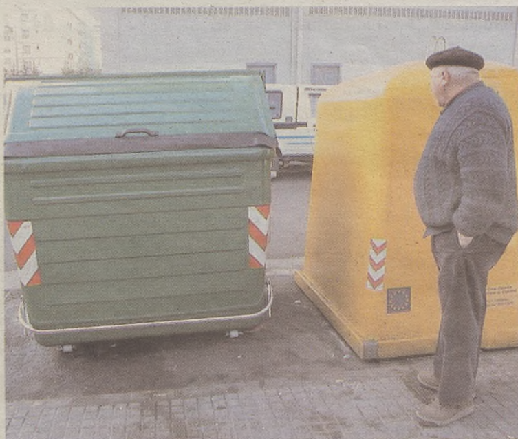
Zaborraren igoera handia iruditu arren, garraio kostuak ordaintzeko da.

Zergen igoerarekin batera hoberi fiskalak onartu zituzten. Aldaketarik handiena herriko komertzio txikiek eraberritze lanengatik ordaindu beharreko zergak izango du: %95eko beherapena.