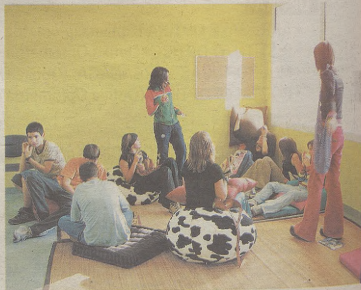
12 eta 17 urte arteko gazte ugari elkartu zen joan zen egubakoitzeko ekitaldian.

Hurrengo egubakoitz eta zapatuan, urriak 21 eta 22, mahai jolasen txapelketa egingo dute: ping-ponga, diana eta mahai futbola. Sariak jasoko dituzte, gainera, txapeladunek. Domekarako, hilak 23, ostera, multiabentura irteera antolatu dute. Burgosera izango da irteera eta hainbat kirol egiteko aukera izango dute gazteek. Joan gura izanez gero aurrez eman behar da izena gaztelekuan bertan. Hilabetea bukatzeko, perkusio ikastaroa izango dute hilaren 28an eta 29an; 30ean, ostera, eskularen tailerra.