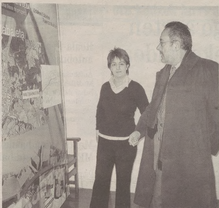
Lehenengo zatia panel bidez erakutsi zuten, baina oraingoan proiektua bakarrik dago.