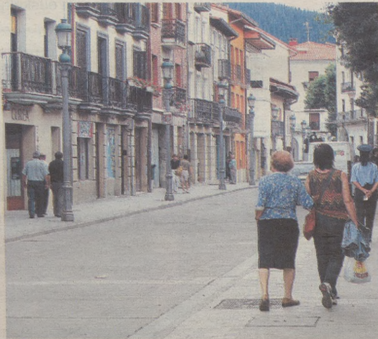
Foru Aldundiak Udalei eman gura die etkez etxeko laguntza zerbitzuaren ardura.

Arautegia balorazioak egiteko erabiliko dute Ongizate Saileko arduradunek