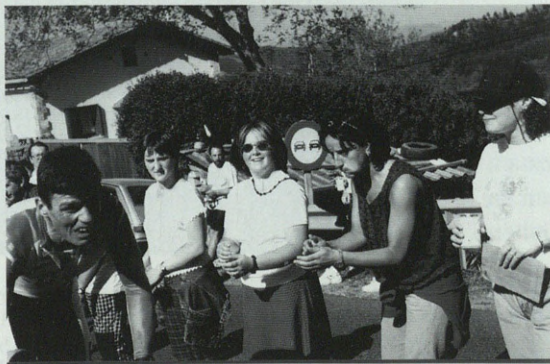
Txirrindularia pozik nesken animoekin

Txarrerako neuken dana azkenerako itzi dotela esango duztazue, baiñe ez nittuke pasetan itxi gureko telebisinoko gorabeherak. ETBtik emun euen erlojupeko probien trasmisiñue etxakon iñori gustau. Txirrindulari gehixenak hasieran eta akaberan baino etzien ikusten. Euskal Herrixe gure bailarako irudi barek geratu zan, lau txakurraundi motorretan ez gastatziarren. Aukera politte izen zan geure txokuek helikopterotik erakusteko, baiña ezin izan gittuen ikusi. Hurrengo baten izen biherko da.