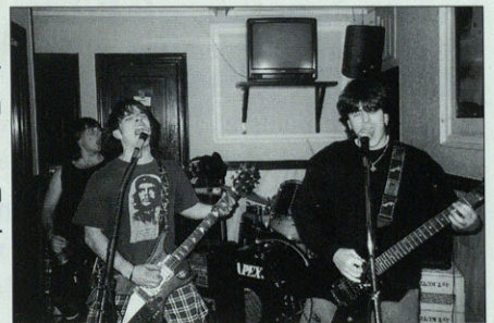
Txarkey taldeak Naira tabernal jo zuen.