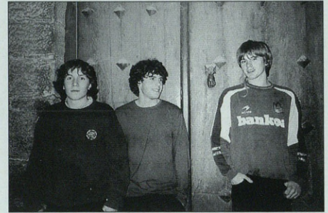
Argazkian Ibai falta da