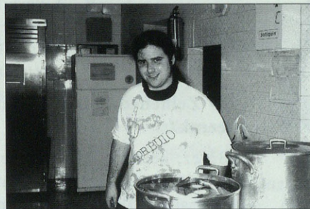
Poto sukaldariak babarrun ederrak prestatuzituen.

zioa egon zen eta egunari hamaiera emateko INTSUMISIOA lau haizetara zabaldu genuen.